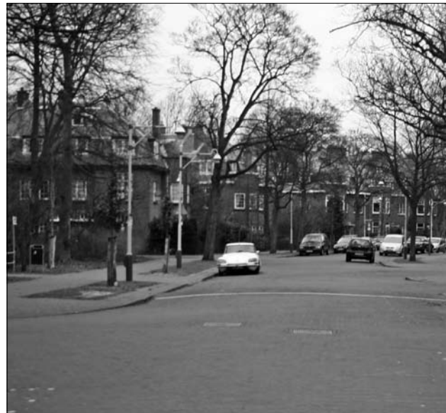
Beeld van de Mezenlaan op een zondagmiddag.

We zijn nu weer vier jaar verder en eigenlijk is er nog steeds helemaal niets gebeurd. Wel heeft het ziekenhuis zelf niet zo lang geleden aangegeven nu echt van plan te zijn om te gaan zorgen voor voldoende parkeerplaatsen op eigen terrein, zo nodig ondergronds.