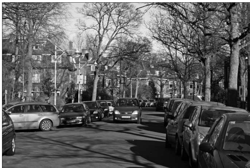
Hetzelfde stuk Mezenlaan op een doordeweekse middag.