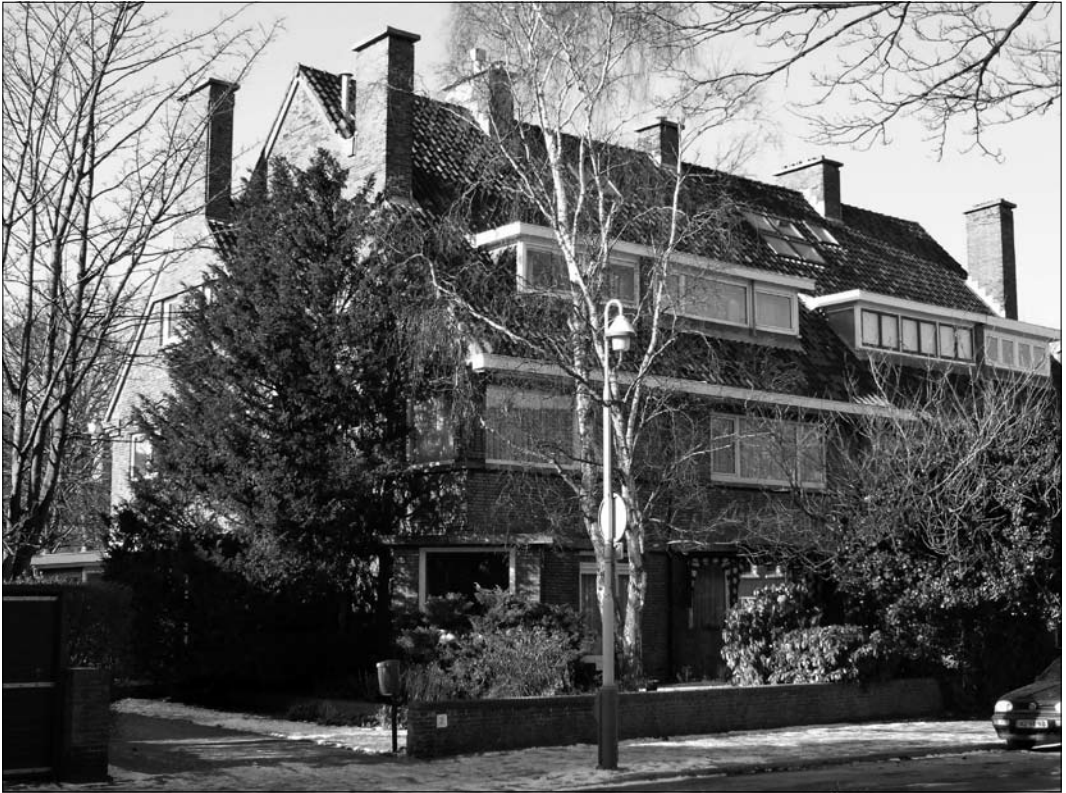
Het huis aan de Wildhoeftaan 2