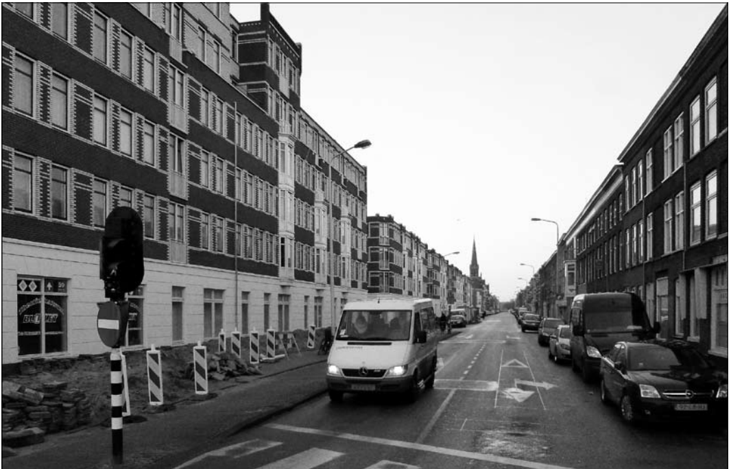
De entree van de Beeklaan

“Als we het niet-opruimen van hondenpoep als voorbeeld nemen, iets wat altijd hoog in de toptien van ergernissen staat, wordt een hondeneigenaar die daarop wordt betrapt