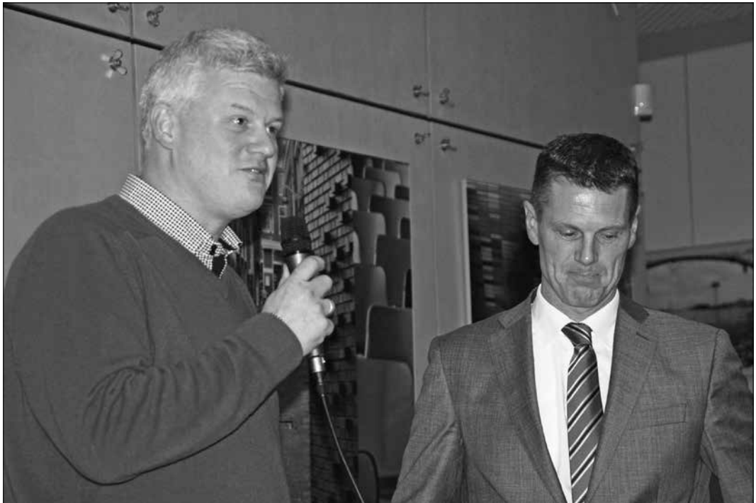
De komende en de gaande voorzitter

„Ik ben geboren in het dorp Wilp, tussen