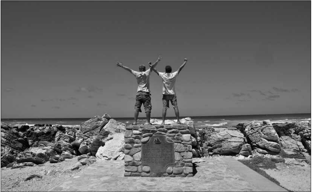
Het team Aarsse heeft The Southernmost Tip Of The Continent Of Africa bereikt

vanuit het midden van het continent de republiek Zuid-Afrika bent binnengekomen. Want daar houdt het primitieve Afrika op. Het doet in één klap zó westers aan, althans als je niet in sloppenwijken á la Soweto komt: goede wegen, moderne gebouwen, relatief veel blanken, betere hygiëne enzovoorts. Dat was echt weer even wennen.”