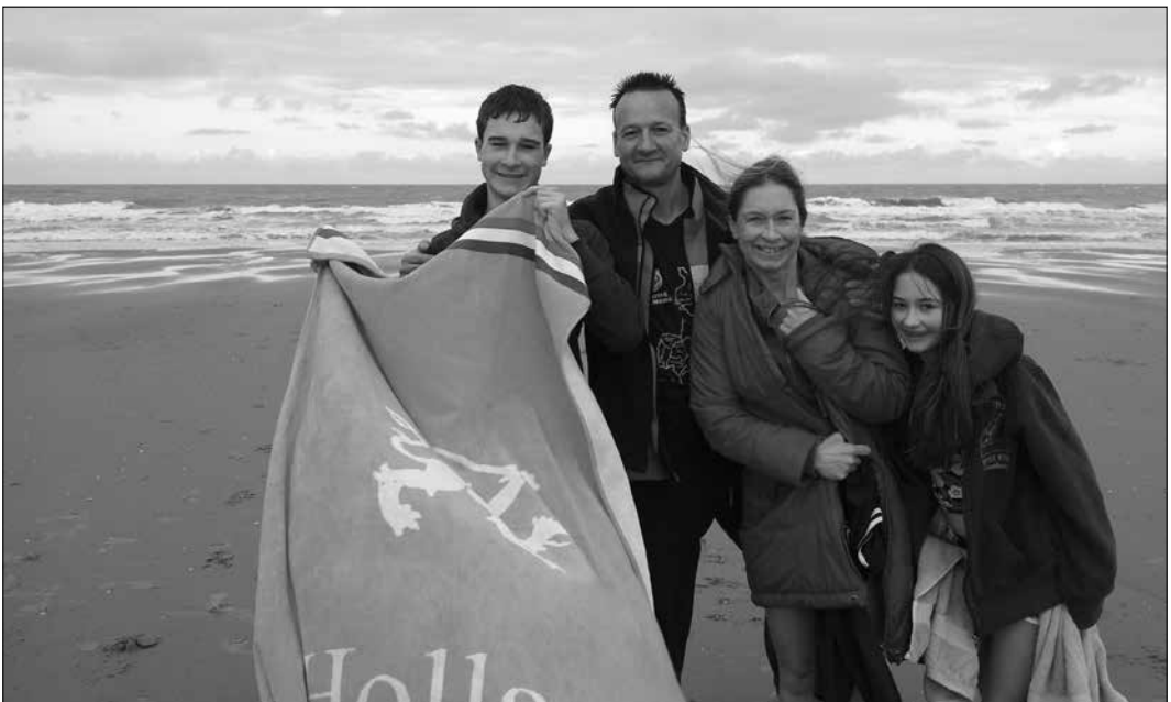
Na de nieuwjaarsduik