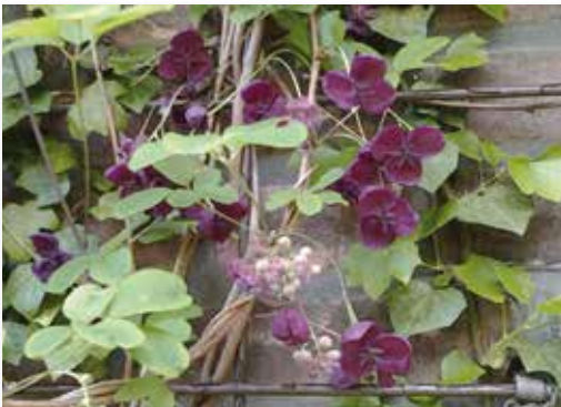
De Akebia in mei