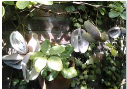
De Akebia in oktober