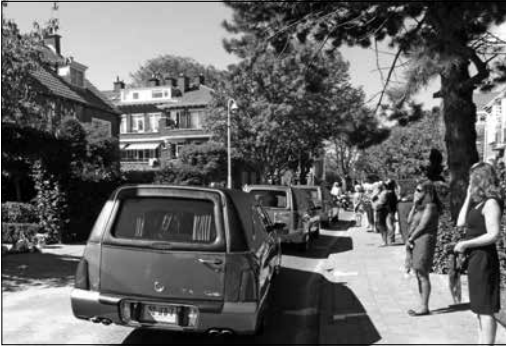
De rouwstoet houdt halt bij het huis van het gezin aan de Spotvogellaan

begrafnis plaats. Bij laatstgenoemde plechtigheid werden witte duiven opgelaten. Inmiddels is in de derde week van september dankzij DNA-sporen ook Julian geïdentificeerd. Op 30 september is zijn kist bijgezet in het familiegraf op Nieuw Eykenduynen.