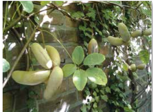
De Akebia in september

De Akebia is een snelle groeier, die wel 10 m of hoger kan worden. Hij wordt helaas in ons land maar weinig aangeplant.