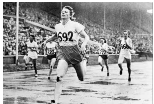
Op de Olympische Spelen van Londen won Fanny Blankers onder meer met een straatlengte voorsprong de 200 meter hardlopen.

In diezelfde periode maakte 'sergeant G. van Os de Man' ook deel uit van een nationaal Nederlands estafette-team op de 4x400 meter, dat werd klaargestoomd voor deelname aan de Olympische Spelen van 1948 in Londen. „Helaas werden we in de