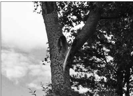
De kapotte abeel