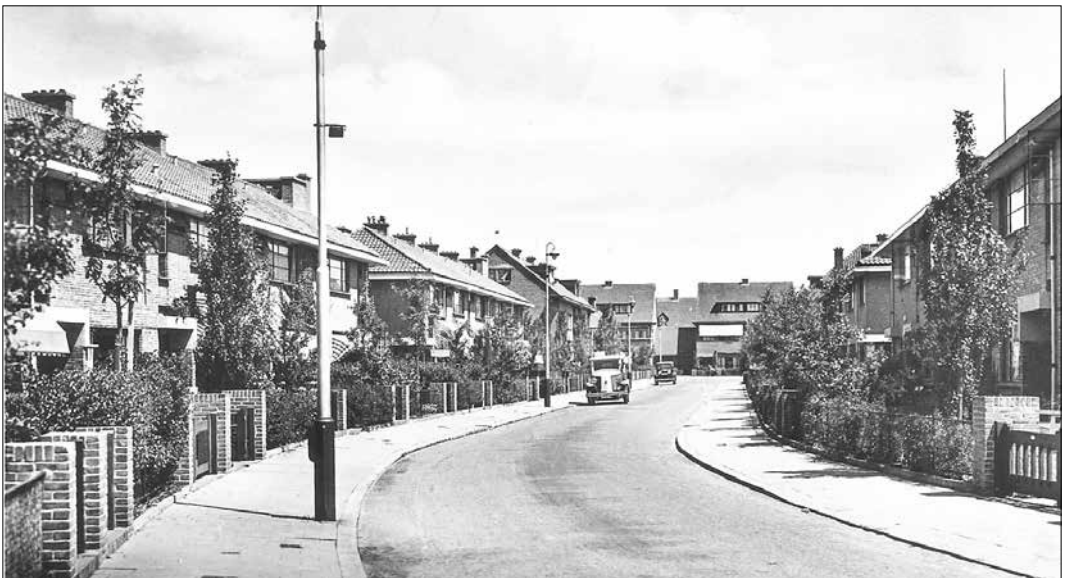
Ansichtkaart van de Tuinfluiterlaan, midden jaren dertig

„In Charleroi had je tot ver in de jaren tachtig nog een paar charmante oude tramlijntjes met stokoud materieel. Die trammetjes reden de hele agglomeratie rond, dwars door die lelijke industriegebieden en langs oude mijnen, soms wel over een traject van vijftientig à dertig kilometer. Ik heb me daar destijds scheel gefotografeerd. In mijn jonge jaren kreeg ik ook al zo'n bijzonder gevoel als ik met lijn 1 vanaf het Spui naar Delft reed. Als-ie dan de Hoornbrug over ging en langs de Vliet en door een weiland reed.... prachtig vond ik dat! En nu moet ik opeens ook denken aan de langste tramlijn van West-Europa: de Kustlijn in België, tussen Knokke en De Panne. Dan ben je 2,5 uur onderweg. Als je dat nog nooit hebt gedaan, moet je 't echt eens doen. Leuk uitje!”