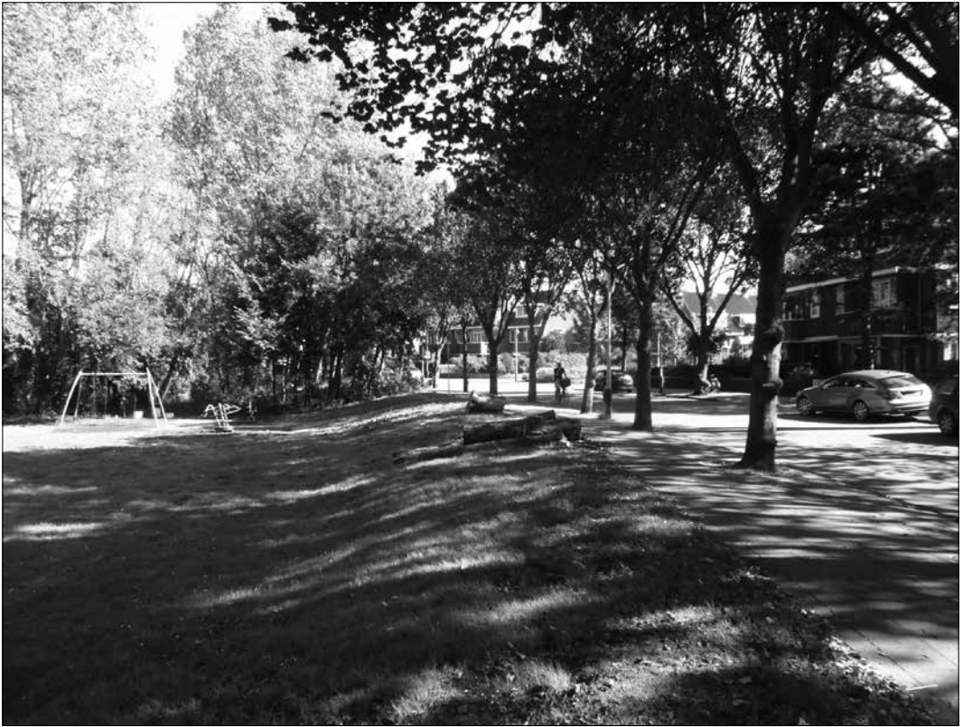
Dit speelgebied zal hoogstwaarschijnlijk niet worden opgeofferd aan woningbouw.

nisbanen worden ingericht als sportveld voor andere sporten. Het voetbalveld/speelveld aan de noordzijde van de Laan van Poot blijft eveneens bestaan. Dat lijkt ons, tezamen met het behoud van de waterlopen en de groenstroken, een goede uitkomst.