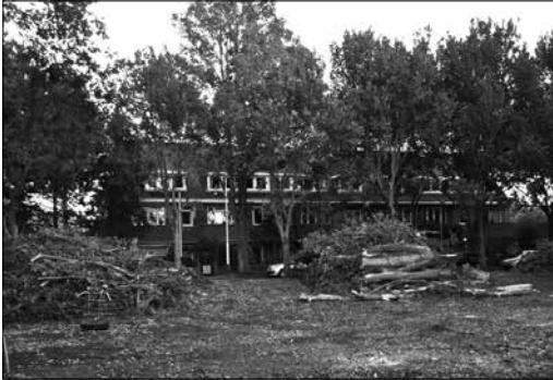
Laan van Poot

Bij de zwaarste julistorm die Nederland de afgelopen honderd jaar heeft getroffen, zijn op zaterdag 25 juli in Den Haag zo'n 240 bomen omgewaaid. Op die middag, waarbij de windkracht bij vlagen 9 à 10 was, kwamen bij de brandweer in de regio Den Haag ruim duizend meldingen van stormschade binnen.