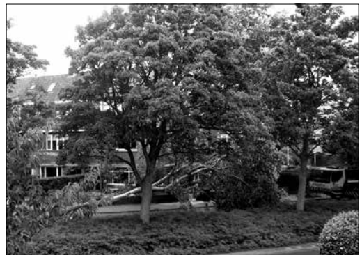
De abeel geveld