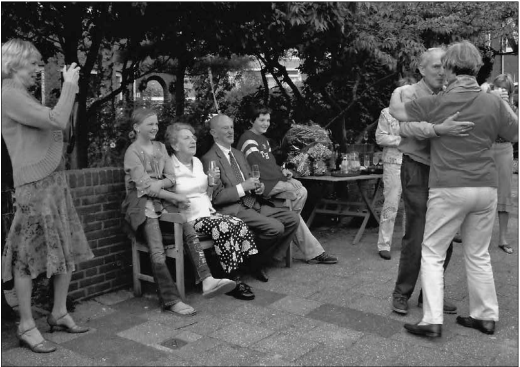
Dansen op de 70-jarige bruiloft