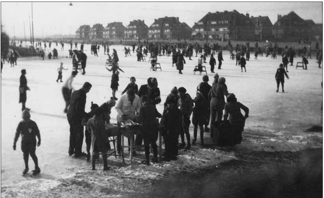
Schaatsen op de Sportlaan