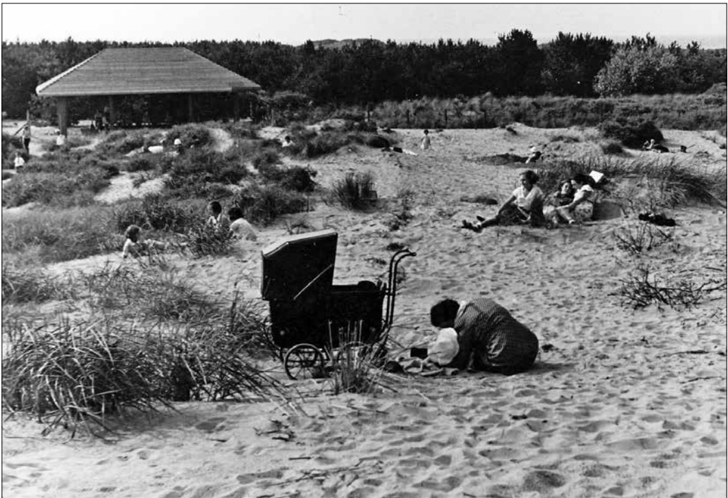
Spelen in de duinen, jaren vijftig

„Niet dat hij daarna stil ging zitten, hoor. Integendeel. Hij nam schilderles aan de Vrije Academie en dat was het begin van een intensief artistiek tweede leven, waarin hij zeer productief is geweest in zeer uiteenlopende