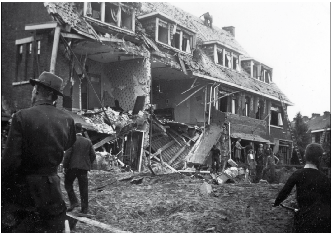
Beeld van de ravage na de val van een Duitse bom op de hoek Eiberplein-Kiplaan op 1 augustus 1941. Hierbij vielen zes doden.

begeleid door de stichting Oorlog in mijn Buurt . Voorafgaand aan de interviews worden verschillende gastlessen gegeven in de klas, over de lokale oorlogsgeschiedenis en over hoe zij moeten interviewen. Ondertussen werken de leerlingen in speciale werkboekjes aan hun eigen historisch onderzoek. Dit maakt van de leerlingen 'echte' historici en journalisten en bereidt hen voor op de interviews met ooggetuigen van oorlog in hun buurt. Door verhalen uit de eerste hand te horen, wordt het historisch besef over hun eigen omgeving versterkt. De kinderen voelen zich daardoor verantwoordelijk deze verhalen zo