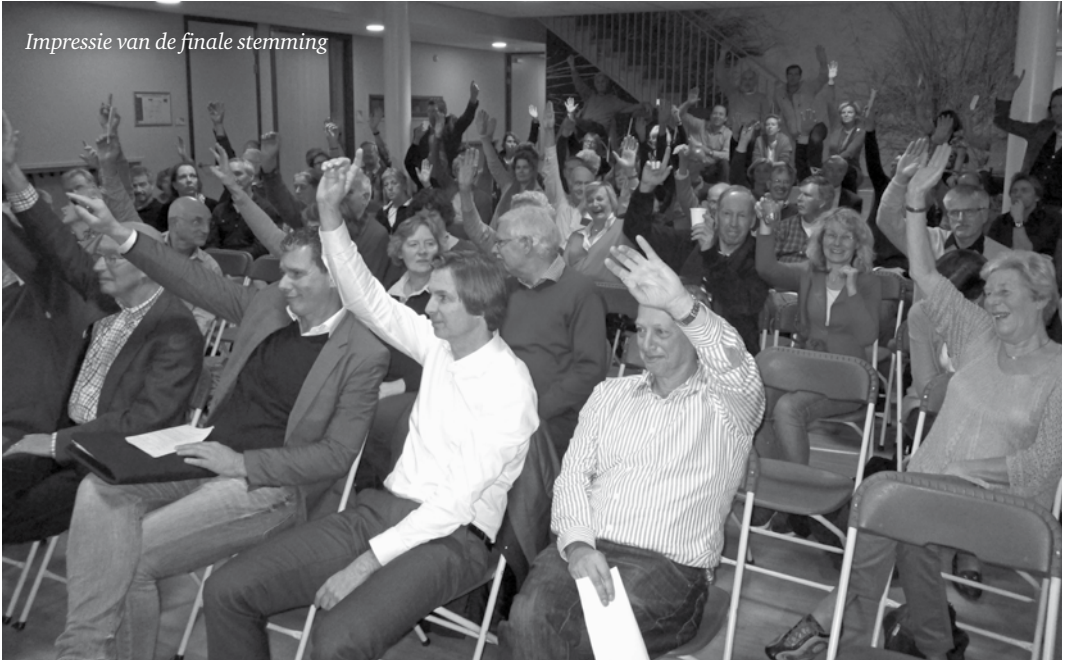
Impressie van de finale stemming

Bewoners van de Laan van Poot aan de zuidkant van de HALO die nu nog vanuit hun voordeur door een groenstrook in de richting van de tennisbanen kijken, vreesden dat hun uitzicht door het appartementengebouw ernstig zou worden verknoeid. Sommige omwonenden bleken zelfs bang voor waardevermindering van hun huis, hoewel objectief gezien een waardevermeerdering eerder voor de hand ligt omdat de buurt met het verdwijnen van de sportacademie juist rustiger wordt en de beoogde nieuwe appartementen tot het luxe segment van de woningmarkt gaan behoren.