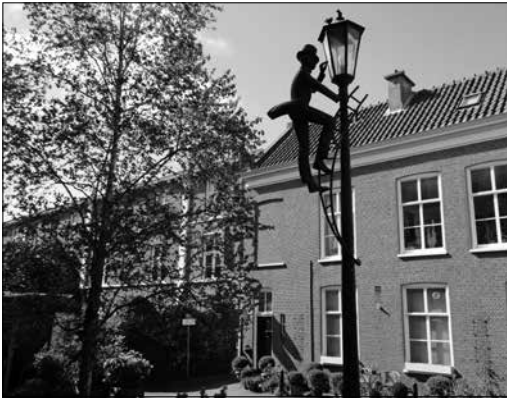
Sculptuur van lantaarnopsteker bij het hofje Schuddegeest (in het complex Mallemolen aan het eind van de Javastraat) dat in 1854 het eerste Haagse sociale woningbouwproject was.