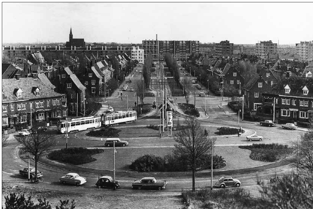
Overzicht van de keerlus van lijn 3 aan het eind van de Kwartellaan in 1962.

bij de Kijkduinsestraat, zij het niet meer als laan maar als plein.