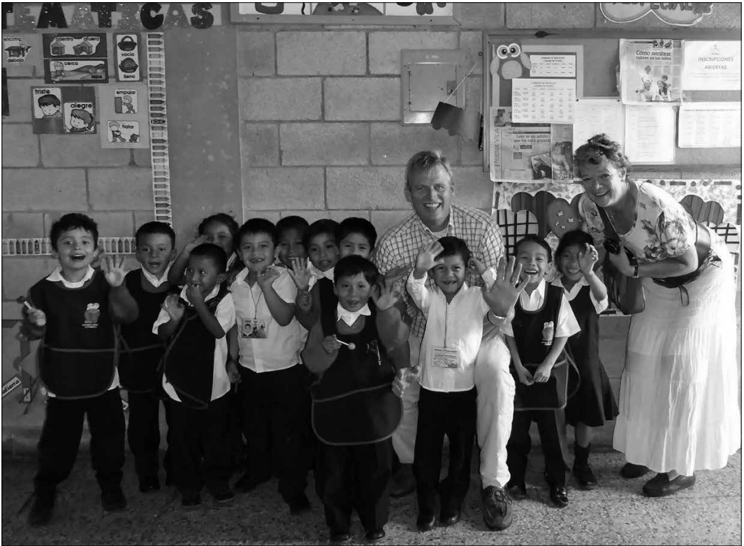
De auteurs van dit artikel in een schoolklas in Guatemala