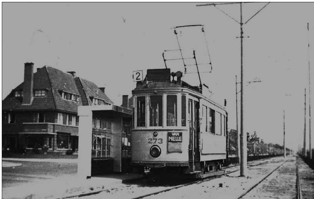
Lijn 2 bij de eindhalte Sportlaan-Buizerdlaan.