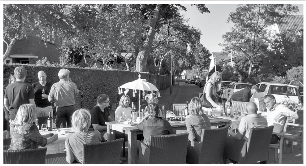
Barbecue op de Eendenlaan

Om alvast warm te lopen voor het grote Vogelwijkfestival van eind september vierden bewoners van diverse lanen in augustus nog een eigen straatfeest. In het septembernummer kwam de Tuinfluiterlaan al aan bod. Bij dezen nog een sfeerbeeld van de Eendenlaan-barbecue van 31 augustus en enkele impressies van het Roodborstlaanfeest dat op 25 augustus plaatsvond.