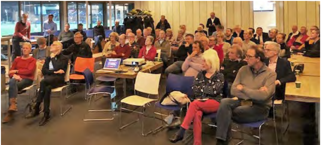
Een aandachtig gehoor

systeem hergebruikt om het aanvoerwater naar de douche mee te helpen verwarmen. Zo wordt douchen goedkoper.