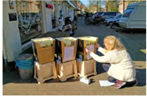
Bloemen bij de bakker

Zo probeert iedereen op zijn eigen manier en met hulp van anderen deze bizarre periode te overleven. We moeten er helaas van uitgaan dat het voorlopig nog niet voorbij is. Stel dat