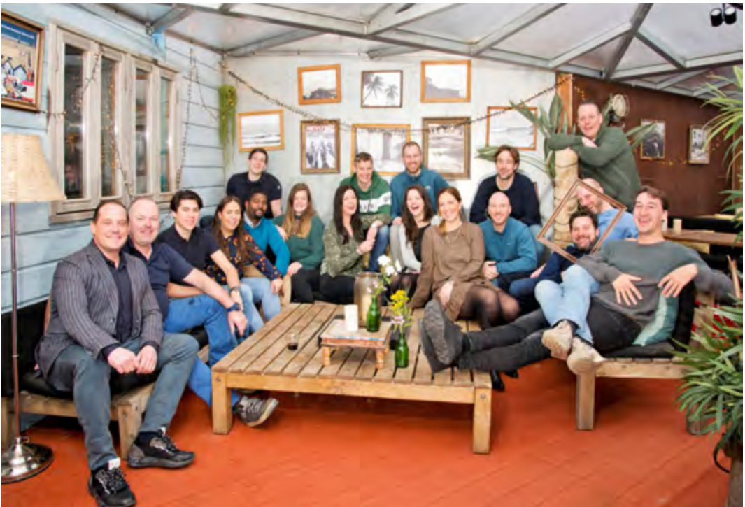
Het team van DB Evenementen & Haagevents