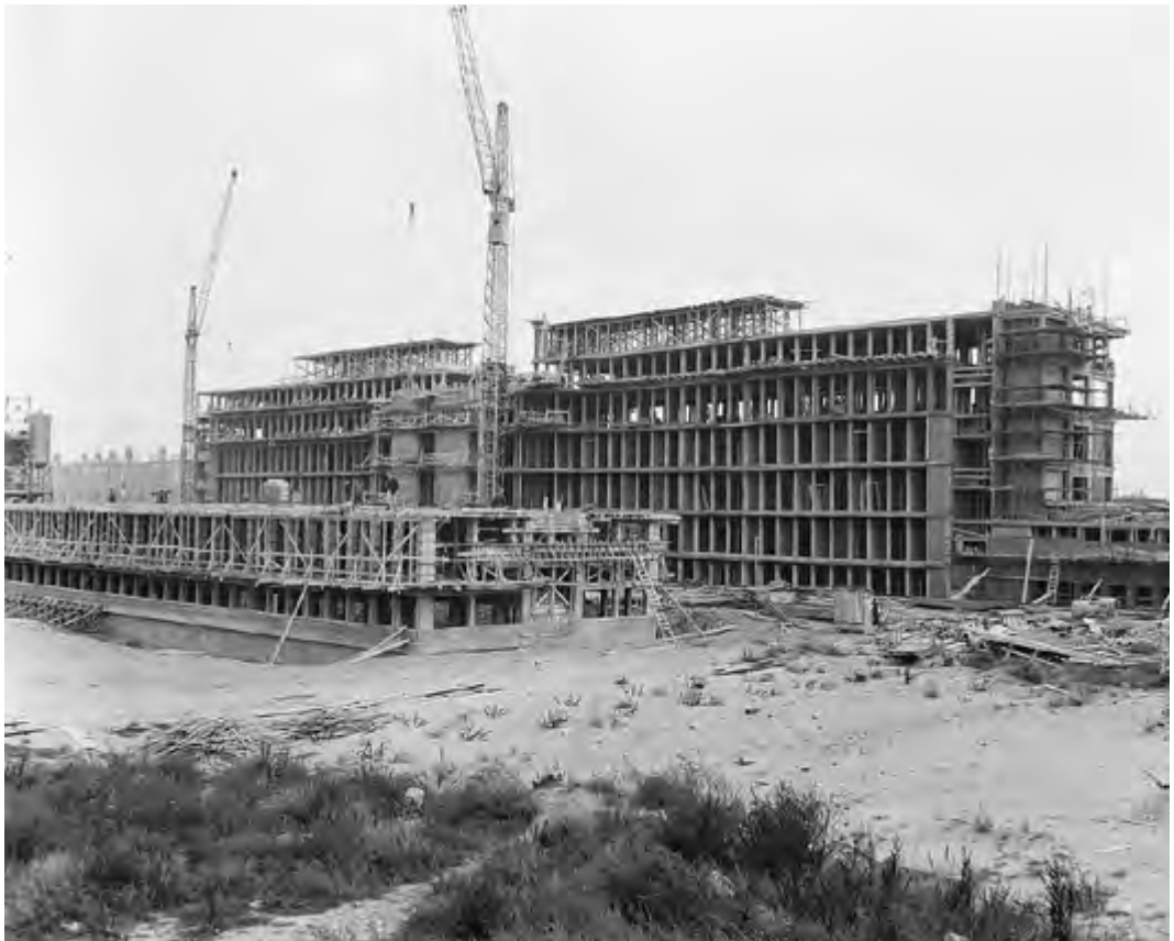
Het naoorlogse Rode Kruisziekenhuis in aanbouw, eind 1957.

In 2004 fuseerden RKZ en JKZ met het ziekenhuis Leyenburg en ontstond de nieuwe naam Haga Ziekenhuis. De ontwikkelingen in de ziekenhuiswereld volgden elkaar echter in rap tempo op, want de zorgkosten bleven de pan uitrijzen. Bezuinigen en streven naar meer efficiency, daar draaide het om. De lig-tijd werd bekort, het aantal bedden kromp en de ziekenhuiszorg ging steeds meer richting eerstelijnszorg. In de toekomst zal zich die trend voortzetten, onder meer door de inzet van digitale communicatiemiddelen. De co-