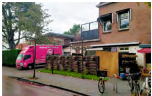
Over de felle zuurstokroze huisstijl van het bakkersbedrijf zijn de meningen onder de cliëntèle verdeeld, maar de recente groene omlijsting en aankleding van de schutting aan de kant van de Zwaluwlaan heeft bijna alom waarderding ontmoet.

De klagende omwonenden, die de bakkerij het liefst morgen al zien verkassen, zijn zoals verwacht niet te spreken over het gemeentelijk voornemen om de broodproductie officieel toe te staan. Zij spreken van een „schaamteloze inhaalbeweging” van de gemeente. Na een wekenlang beraad over de vraag of het de moeite waard is hun strijd tegen de bakkerij voort te zetten, besloot het tweetal eind oktober alsnog bezwaar aan te tekenen tegen het gemeentelijk besluit.