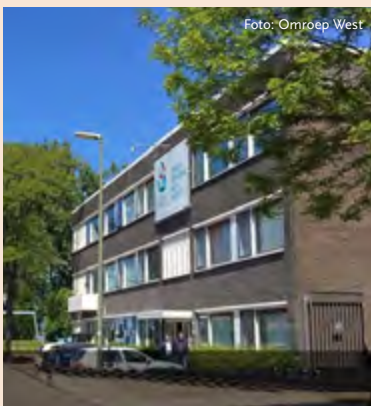
De nieuwe opvanglocatie

De ongeveer zeventig daklozen die tijdelijk zijn opgevangen in het voormalige Juliana Kinderziekenhuis aan de Sportlaan, verhuizen op dinsdag 17 november naar een nieuwe opvanglocatie aan de Schenkweg, langs het spoor achter het Centraal Station. Bijna twee jaar heeft het gebouw aan de Sportlaan dienst gedaan als ‘doorstroomlocatie’ voor Haagse daklozen die door de Kessler Stichting worden begeleid naar zelfstandig wonen. Op de verhuisdag vertrekken de bewoners van de Sportlaanopvang eerst naar de Mondriaan-hotelschool in het Bezuidenhout, waar ze een lunch krijgen aangeboden. Vanaf 18.00 uur kunnen zij in het nieuwe opvangcentrum hun intrek nemen.