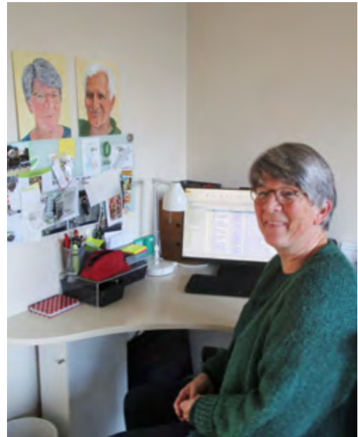
In de computerhoek met de geschilderde portretten

„Ik heb wel mijn verdrietige momenten hoor, en dat laat ik gewoon gebeuren. Nu de afstand