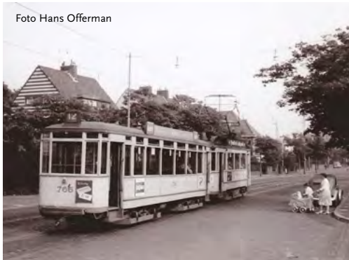
Lijn 12 op de Nieboerweg in 1955

het mogelijk om tevens een aantal lang gekesterde verbeteringen te realiseren voor het fietsverkeer en voor de verkeersveiligheid. ‘Werk met werk maken’ noemt men dat in gemeentelijke kringen. Zo wordt bijvoorbeeld gekeken naar mogelijkheden om de positie en de veiligheid van het fietsverkeer in de Goudenregenstraat en de Duivelandsestraat te verbeteren, bijvoorbeeld door versmalling van de trottoirs en de aanleg van fietsstroken. Ook is het de bedoeling de verkeersveiligheid op enkele kruispunten te vergroten en bepaalde oversteekplaatsen voor voetgangers veiliger te maken. Mede omdat het wegprofiel van de Nieboerweg tamelijk breed is en er al fietsstroken liggen, zullen de noodzakelijke aanpassingen daar minder ingrijpend zijn dan in de Goudenregenstraat en de Duivelandsestraat. Wel zullen op de Nieboerweg de tramhaltes aangepast en mogelijk verplaatst worden om deze beter toegankelijk te maken en een gelijkvloerse instap in de tram mogelijk te maken.