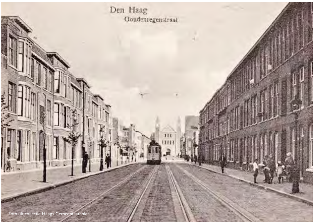
De Goudenregenstraat in 1923

Door het beschikbaar gestelde budget voor de komst van de nieuwe trams op lijn 12 is