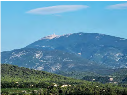
De Mont Ventoux met z'n karakteristieke kale kruin.