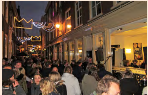
Grote drukte in de Oude Molstraat bij de opening van Harpoon

in Scheveningen. Op 8 februari is Harpoon feestelijk geopend. Overigens is Jeroen Kuiper vorig jaar ook mede-eigenaar geworden van restaurant Cru , gevestigd in een voormalige vleeschhouwerij in de Badhuisstraat. Zie: https://restaurantcru.nl