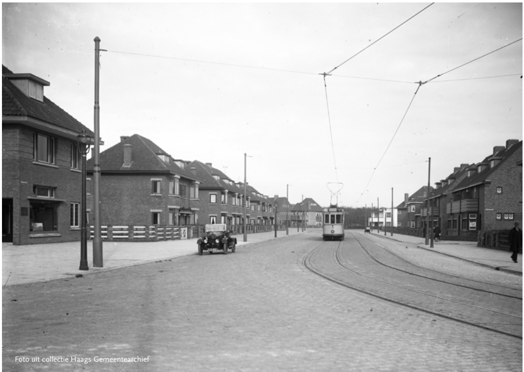
Lijn 12 op de Nieboerweg in 1924

De nieuwe trams zullen naar verwachting veel gelijkenis vertonen met de al in gebruik zijnde Avenio-trams van Siemens. Deze trams hebben niet alleen een lage vloer, maar zijn ook een paar meter langer en iets breder (10 tot 15 cm aan iedere kant) dan de oude GTL8-trams. De beoogde gelijkvloerse instap bij de haltes