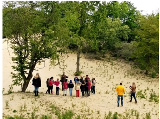
Duineexcursie voor kinderen

NatuurWijs. Via die organisatie trekken basisschoolklassen de natuur in en leren die kennen via opdrachten en spelvormen. En dat op verschillende momenten in het jaar. Daarnaast begon Hans vanaf 2015 natuur-uitstapjes te organiseren voor de groepen 5 en 6 van Haagse basisscholen, onder het motto ‘Kijken door de ogen van de boswachter’, een soort mini NatuurWijs-excursie van 2 uur. „NatuurWijs blijf ik na mijn pensionering doen en daar is vanuit de scholen veel belangstelling voor,” zegt hij.