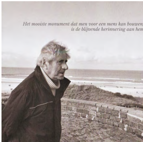
Deze afbeelding sierde de rouwkaart

Op 11 november deelde hij nog vrolijk snoepjes uit aan kinderen die met hun Sint-Maartenslampionnen langskwamen. Niet veel later werd hij ziek. Een blaasontsteking bleek meer te zijn dan dat. Hij verzwakte zinderogen en op 26 december was de kaars opgebrand.