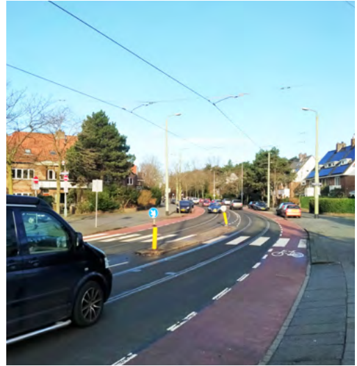
Het kruispunt Nieboerweg-Laan van Poot, waar de afgelopen jaren al vele ongelukken zijn gebeurd

We vertrouwen erop dat we met deze maat-