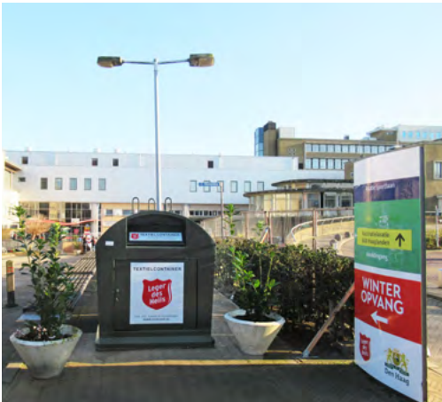
Overzicht van de entree met de kledingcontainer, waarin veelvuldig tweedehands kleren zijn gedoneerd

schoon te houden.” Met een lach laat hij erop volgen dat er bewoners zijn die soms van hun eigen privévertrek „een kleine puinhoop maken”, maar dat duurt nooit lang, want de kamers worden geregeld gecontroleerd.