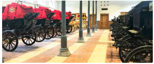
Een van de jaarlijkse uitstapjes van Curiositas in de afgelopen twee decennia ging naar de Koninklijke Stallen