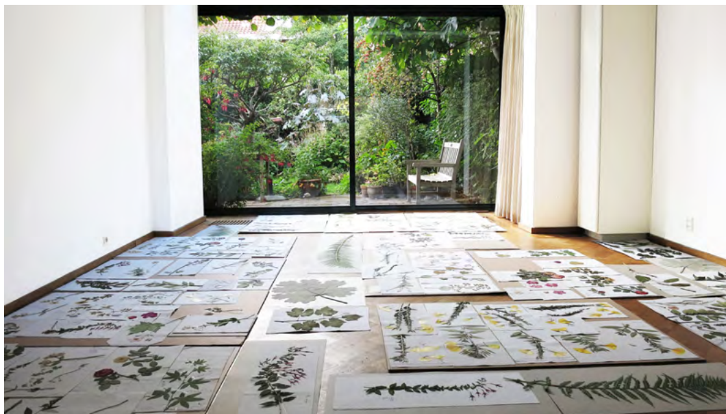
Gedroogde bloemen en uitzicht op de tuin in september vorig jaar

Ik ben blij dat ik dit kan doen. Het is afscheid nemen van een heel fijne plek en het bewaren van het werk dat mijn moeder met veel plezier en liefde in haar tuin heeft gestopt. Ik heb het idee dat ik door de tuin op deze manier vast te leggen ook een stukje van mijn moeder vastleg.