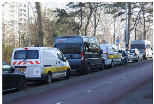
De ventweg langs de flats en het fietspad aan de Houtrustweg stond de afgelopen jaren altijd vol geparkeerd met voertuigen uit omliggende wijken waar al betaald parkeren gold.