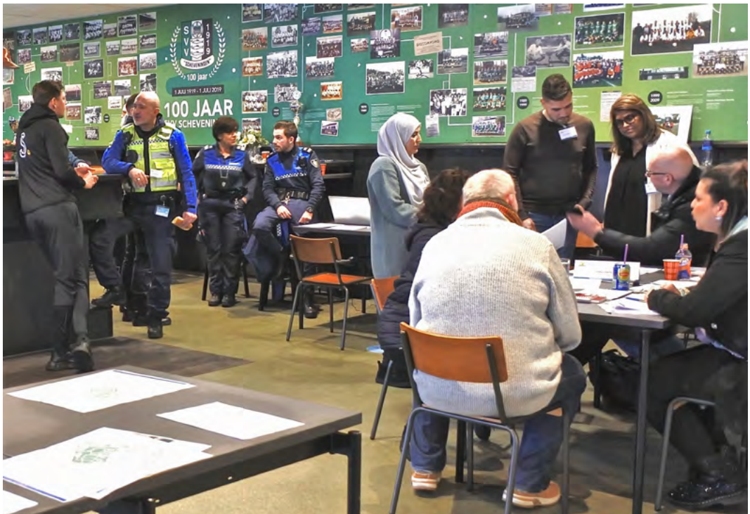
Tijdens de matig bezochte inloop-informatieavond op 7 maart bij SVV Scheveningen konden mensen worden geholpen bij het aanvragen van o.a. een bewonersvergunning, bezoekersvergunning of mantelzorgersvergunning.

Ten opzichte van het oorspronkelijke plan zijn wel enkele aanpassingen aangebracht. Zo vallen de vier tot nu toe nog vrije parkeerplaatsen die op de Nieboerweg vlak bij de Duivelandsestraat liggen voortaan onder het parkeerregime van Duindorp, waar al vanaf 13.00 uur moet worden betaald. Verder kost het parkeren 's avonds ook geld voor auto's die worden neergezet op het grote parkeerterrein achter discotheek Westwood, bij de rioolwaterzuivering aan het begin van de Laan van Poot. Ten slotte mogen grote voertuigen zoals campers en vrachtwagens geparkeerd blijven worden op een deel van de parkeerstrook langs de kanaalkant van de Houtrustweg, maar voor deze parkeerplekken moet dan ook in de avonduren worden betaald. Parkeerplaatsen