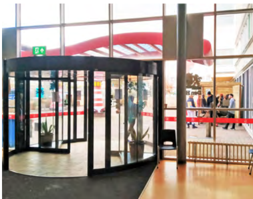
Om te voorkomen dat de nabije bushaltes als hangplek werden gebruikt, is vlak voor de ingang van de opvanglocatie een strook met zitjes ingericht. Daar mogen de bewoners roken en drinken.

Verder hebben de twee supermarkten en enkele andere winkeliers in de Fahrenheitstraat de afgelopen maanden helaas last gehad van winkeldiefstal of vervelend gedrag door bepaalde bewoners van de opvang. Daarover is contact geweest tussen de politie en de ma-