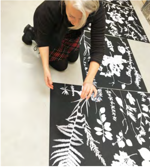
Vorbereiding van de sjablonen voor de zeefdruk