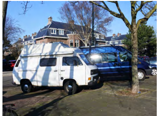
Dit beeld van gestalde campertjes op het eerste deel van de Sportlaan zal vanaf komende maand ongetwijfeld minder te zien zijn