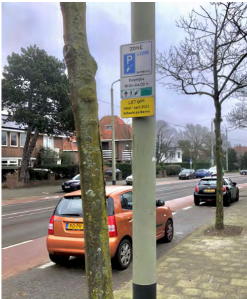
Aankondiging van het nieuwe parkeerregime op de Nieboerweg

Door de maatregel zal de parkeeroverlast in Vogelwijk-Noord door bedrijfsbusjes, campers en personenauto's uit andere wijken aanzienlijk afnemen. Alom wordt echter verwacht dat het probleem zich zal verplaatsen naar het midden van de wijk. De kans is dan ook groot dat dit waterbed-effect op den duur zal leiden tot betaald parkeren in de gehele wijk.