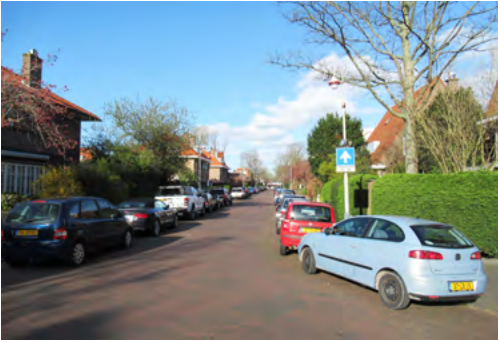
Sijzenlaan-midden op een avond half april

waarna de verlaagde stoeprand voor de oprit wordt vervangen door een hoge rand. De totale kosten daarvan, die de aanvrager zelf moet betalen, bedragen naar schatting 1500 euro.