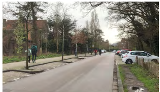
Begin Laan van Poot: nu parkeerplekken zat

Een doorn in het oog van veel bewoners in Vogelwijk-Midden is dat veel auto's van 'parkeertoeristen' uit omliggende wijken fout geparkeerd staan: te dicht bij een hoek of zelfs op het trottoir. Volgens Pieter Delleman zal dat euvel echter geleidelijk minder worden omdat er geregeld wordt gecontroleerd door handhavers (BOA's), die zonder pardon verbaliserend optreden.