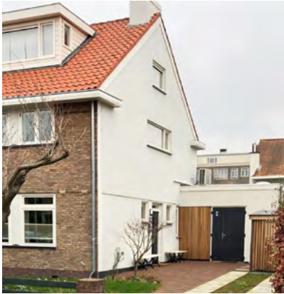
Zijgevel-isolatie met stucwerk (Sijzenlaan)