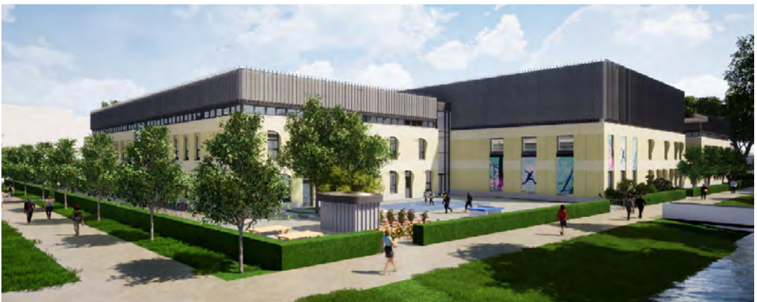
Een deel van het nieuwe scholencomplex in Waldeck

De Mariaschool was gelieerd aan de Theresiaschool, een rooms-katholieke school voor jongens die aan de Parkietlaan stond. Na uitbreiding van de Theresiaschool in de jaren zestig volgde een fusie met de Mariaschool, waaruit de huidige basisschool De Parkiet voortkwam. Het karakteristieke schoolgebouw aan de Haviklaan 1 kreeg toen de functie van school voor speciaal basisonderwijs, genoemd naar de legendarische negentiende-eeuwse pastoor van het Franse stadje Ars-sur-Formans, die uiteindelijk door de rooms-katholieke kerk heilig werd verklaard.