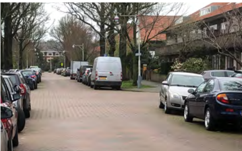
De doorgaans rustige Patrijslaan, zondag 2 april

In Vogelwijk-Noord hebben zo'n 25 bewoners bezwaar aangetekend tegen de gemeentelijke stellingname dat ze bij hun huis een oprit met privé-parkeerplek hebben, waar hun auto voortaan moet worden neergezet. Deze zaken zijn nog in behandeling. Veel opritten zijn al jaren niet meer in gebruik, hebben een andere bestemming gekregen of zijn simpelweg te smal voor de huidige autotypen.