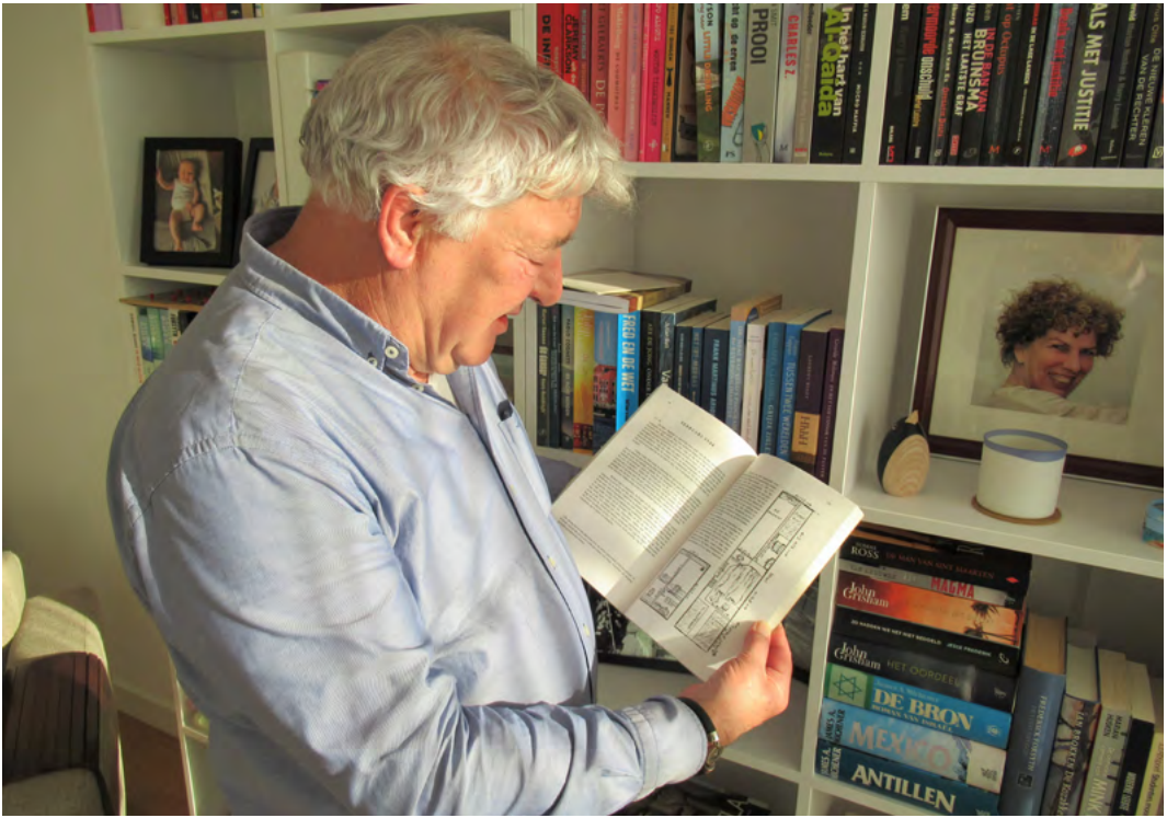
Het boek waardoor Rick de geheime doorgang herontdekte

sen van crimineel geld tegen te gaan. Personen en bedrijven, zoals banken, notarissen, casino's en autodealers moesten bij justitie melding maken van ongewoon grote betalingen met contant geld of grote geldwisseltransacties.”