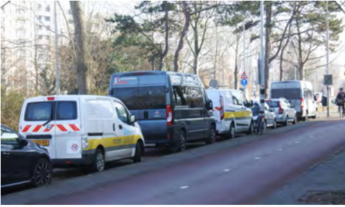
De Houtrustweg voor en na invoering van betaald parkeren tijdens de avonduren