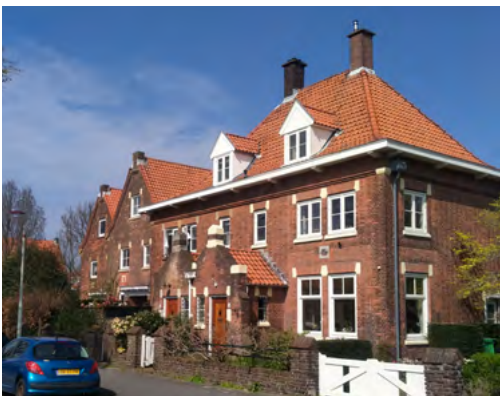
Bij monumentale panden, zoals op de Kwartellaan, is isolatie aan de buitenkant niet mogelijk zonder het aanzien aan te tasten

is de herijking van de Welstandsnota ook een kans. Denk bij isolatie in opeenvolgende stappen: Is er wel/geen vergunning nodig? Zijn er voorbeeldtekeningen? Etc.