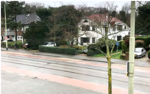
De Nieboerweg op zaterdagavond 1 april

De invoering van betaald parkeren gedurende de avond in het noorden van de wijk verliep begin april allesbehalve geruisloos. Blijdschap en opluchting in Vogelwijk-Noord omdat de parkeeroverlast van voertuigen uit andere wijken er in één klap verleden tijd was. Schrik en frustratie bij bewoners ten zuiden van de Nieboerweg, die opeens stampvol geparkeerde straten hadden gekregen en nu ook zo snel mogelijk betaald parkeren willen. Volgens de gemeente kan dat op z'n vroegst pas begin volgend jaar. En dan was er ook nog de discussie over de veelal onnodig geachte POET-regeling. Daarover ligt nu een brief van het wijkbestuur bij wethouder Mulder.