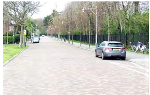
De Houtrustlaan 's avonds voor en na 1 april

Bewoners met een eigen oprit hebben overigens wel de mogelijkheid om die bij de gemeente vervallen te doen verklaren. Daar moet een vergunning voor worden aangevraagd,