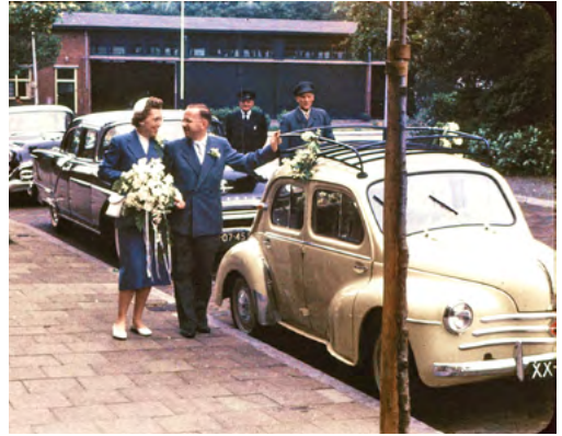
Op 4 juli 1958 traden de ouders van Maarten in het huwelijk. Ze gingen wonen in het huis van Maartens grootouders aan de Laan van Poot 124, met uitzicht op de voormalige Duitse garageloods.

Maar er waren ook nog vier andere voertuigen, kleiner en minder imposant maar in dezelfde kleur. In grote letters stond het drieletterwoord DAF op hun neus. Zij kwamen uit het achterste deel van de garage en waren een beetje zielig, vonden mijn broertje en ik, want zij werden veel minder vaak uitgelaten. Maar ze hadden wel iets bijzonders: elk had een ingewikkeld ogend machientje op twee wielen achter zich aan hobbelen. Diezelfde machientjes hoorden we vaak op zaterdag, als we terugkwamen van de markt, bij het achtereind van de garage sputteren en knetteren. Mijn vader noemde ze aggregaten, maar voor ons was het simpelweg het vertrouwde geluid van de zaterdagochtend. Pas onlangs ontdekte ik ze op internet in een filmpje over de BB: het waren pompen om bluswater uit vijvers en grachten op te pompen. De DAF-voertuigen hadden wij