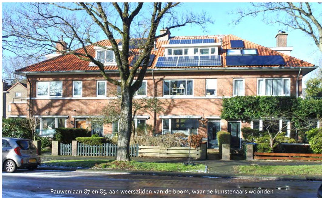
Pauwenlaan 87 en 85, aan weerszijden van de boom, waar de kunstenaars woonden