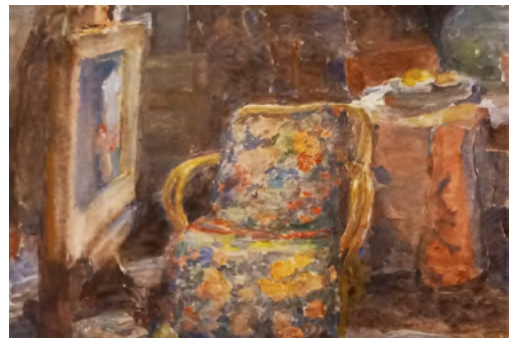
Bont stoeltje in atelier Pauwenlaan