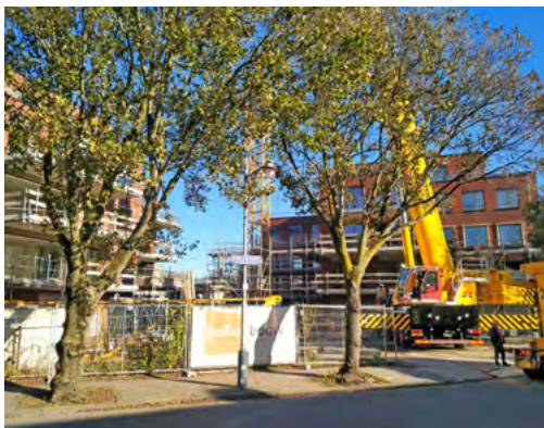
Hellasduin in aanbouw - oktober 2021

We frissen even uw geheugen op. In mei 2022 zijn de 42 appartementen van het Hellasduin-complex opgeleverd en zijn de eerste bewoners erin getrokken. Op de plaats waar vele jaren de HALO had gestaan, was op initiatief van een aantal Vogelwijkbewoners een prachtig 'zelfbouwproject' realiteit geworden. Door én voor de bewoners. Het idee ontstond in 2014 toen de gevolgen van de kredietcrisis nog volop voelbaar waren en geen enkele pro-