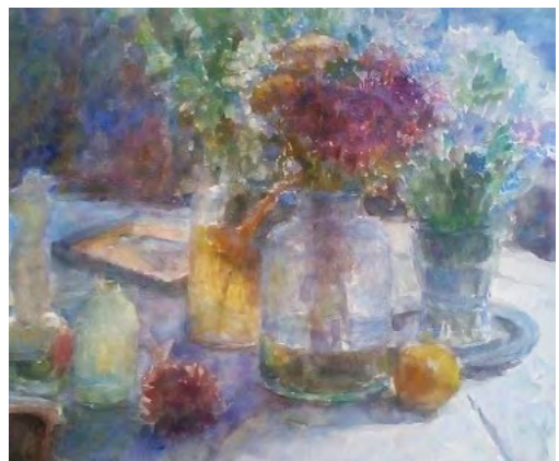
Interieur met bloemstilven, getiteld "Tegenlicht". Geëxposeerd tijdens een overzichtstentoonstelling in Pulchri Studio, oktober 1968