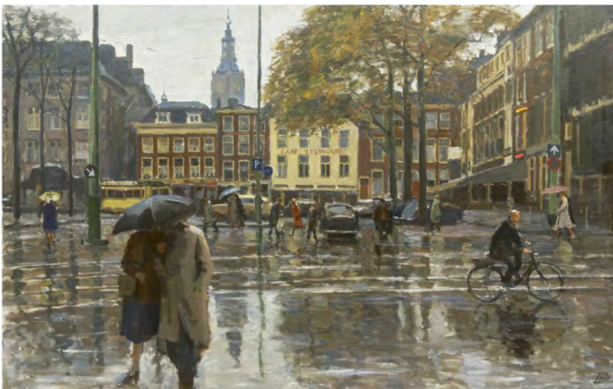
'Samen onder de paraplu op het Buitenhof', ca. 1963