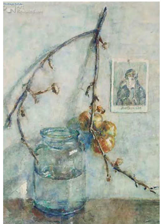
Tak met appeltjes in glazen pot