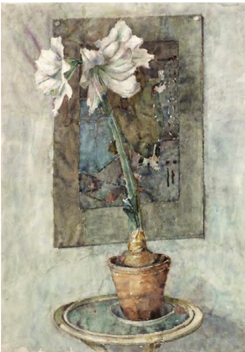
Witte amaryllis (bekroond met de Jacob Hartogprijs)