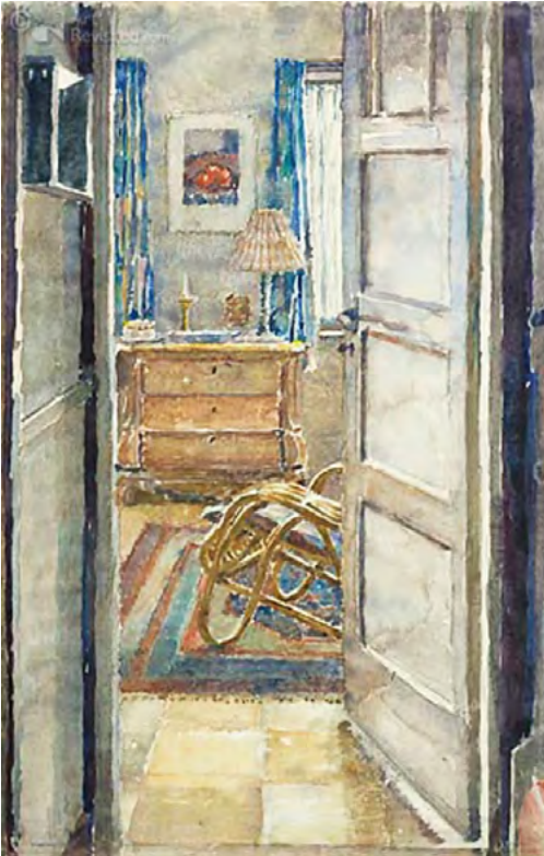
Interieur Pauwenlaan 87