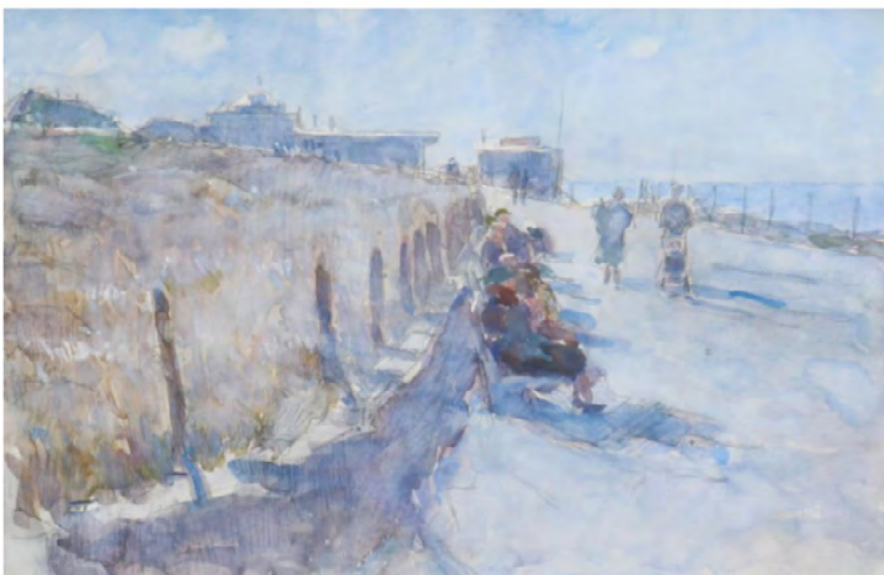
Flaneren langs het strand bij Kijkduin

oorspronkelijk vandaan komt. Hier omarmt Piet ook het schilderen in olieverf weer. Hij overlijdt in augustus 2001 in Den Hoorn. Het werk van de burens aan de Pauwenlaan, Rudolf de Bruyn Ouboter en Piet van Boxel wordt nog steeds gezocht en gekocht door