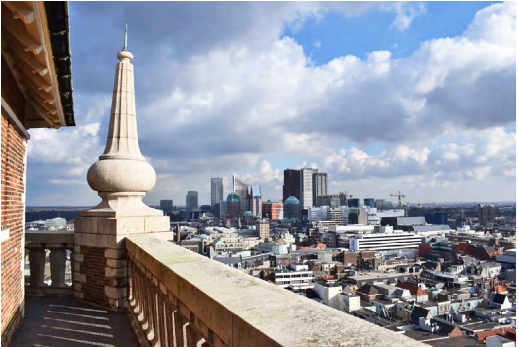
Uitzicht vanaf de eerste torentrans

zijn oog vallen op de klokken voor andere doeleinden dan het mooie geluid. Tijdens de Tweede Wereldoorlog werden ze gevorderd door de Duitsers voor hun oorlogsindustrie. Maar Wie met klokken schiet, wint de oorlog niet en Klokken uit de toren, oorlog verloren , aldus de volksgezegden. Dat gold ook voor de Haagse torenklokken.