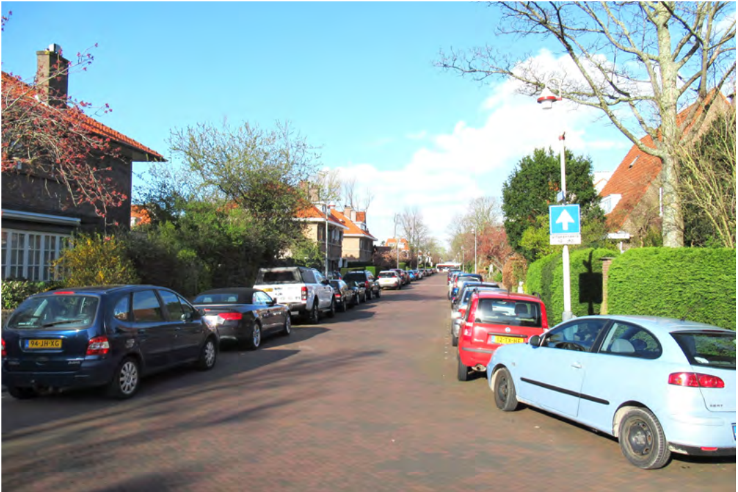
Beeld van het waterbedeffect in Vogelwijk-Midden na invoering van betaald parkeren in het noordelijk deel van de wijk

Sinds vorig jaar april in het Noorden van de Vogelwijk gedurende de avonduren voor parkeren moet worden betaald (een wens van de meerderheid van de bewoners aldaar) kreeg met name het midden van de wijk te maken met het zogeheten waterbed-effect. Bezitters van personenauto's, bedrijfsbusjes en campers uit de omgeving zochten 's avonds hun heil voortaan hier omdat parkeren er nog gratis was. Al snel gingen er in Vogelwijk-Midden tal van stemmen op – en in mindere mate ook in Zuid - om daar dan ook maar op korte termijn betaald parkeren in te voeren. De gemeente had immers al vóór de invoering van het parkeerregime in Noord besloten in vrijwel geheel Den Haag betaald parkeren in te voeren.