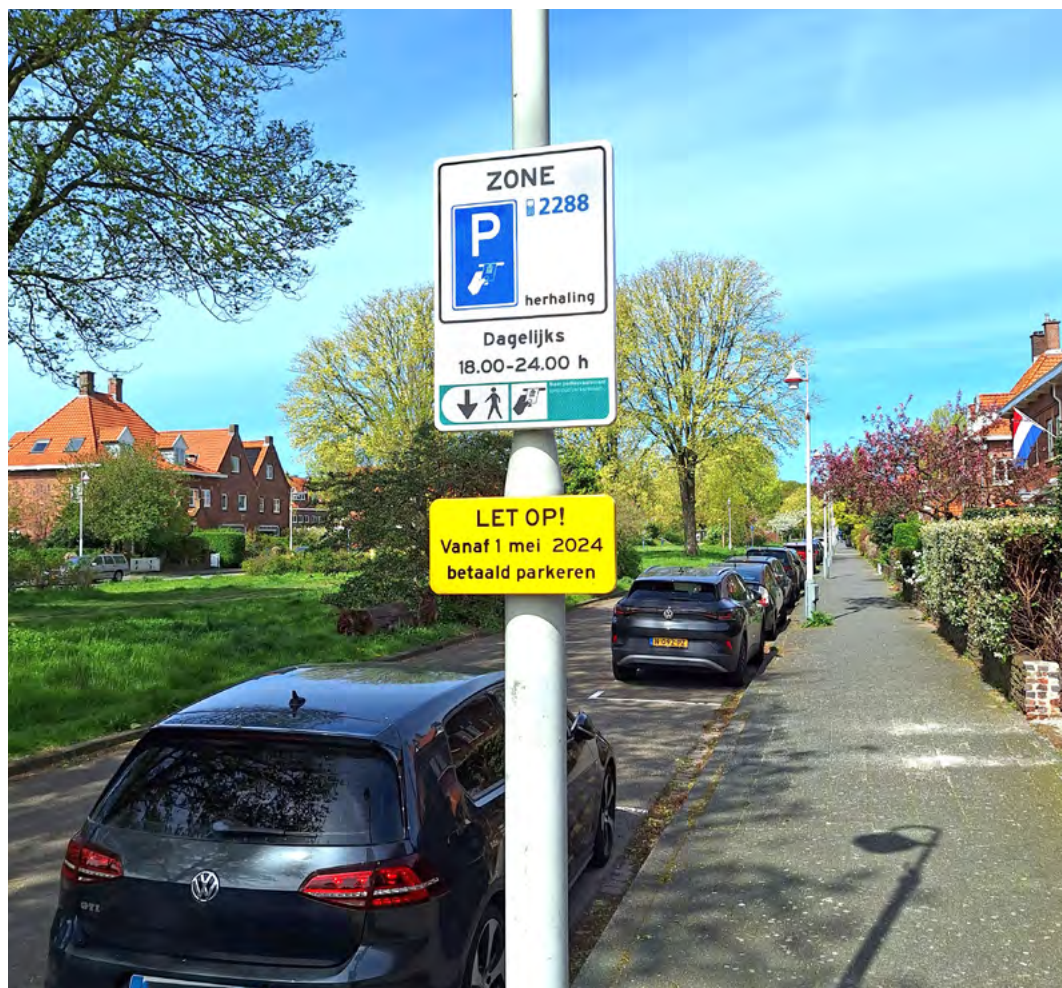
Aankondiging van de invoering van betaald parkeren op de Kwartellaan

De afgelopen maand heeft de invoering van betaald parkeren in het midden en zuiden van de wijk per 1 mei tot veel verwarring, discussie en verontwaardiging geleid. Dat was vooral te wijten aan onduidelijkheden en onjuistheden in gemeentelijke brieven en mails aan de bewoners van de betreffende wijkdelen. Met name de regeling aangaande 'Parkeren Op Eigen Terrein' (POET) bracht veel ophef teweeg. Ook na de gemeentelijke informatieavond op 16 april bij Quik tasten velen nog in het duister