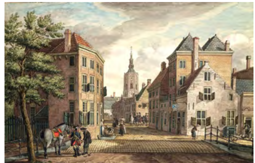
De Haagse Toren in 1775, gezien vanuit de Prinsstraat op een schilderij van P.C. La Fargue

Die toren-excursie is een interessant uitstapje, waarbij je niet alleen de kans krijgt om aan je conditie te werken (de toren telt 288 treden!) maar ook - eenmaal boven - van een specta-