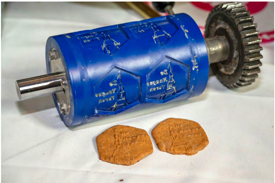
De ‘wals’ die in de koekjesmachine de afdruk van de toren in het deeg maakt.

Per gids kunnen maximaal 15 personen mee. Aanbevolen wordt tickets online te reserveren. De verzameltijd is een kwartier voor aanvang van de tour bij de hoofdingang aan de Torenstraat. Duur van de beklimming: ± 1 uur.