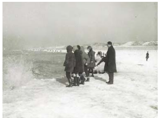
De deels bevroren zee bij Scheveningen in de barre winter van 1962-1963