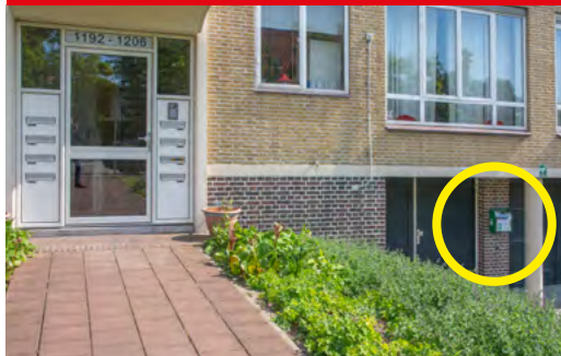
Sportlaan 1208 nabij Kwartellaan