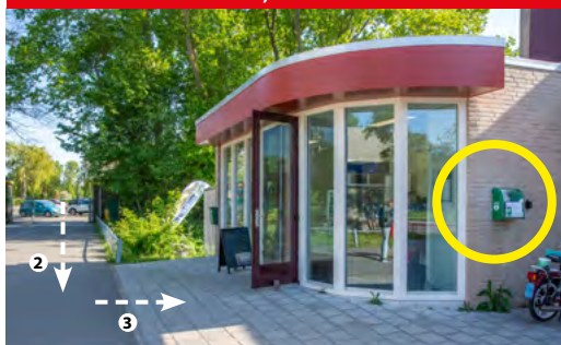
Health Club Westduin - AED achter de ingang