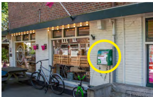
Mezenlaan 42B - Bakker Driessen