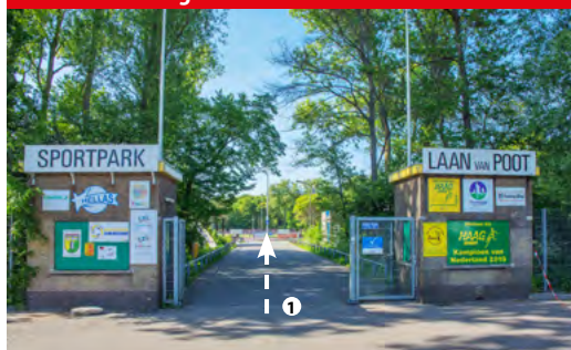
Laan van Poot 363 - Health Club Westduin