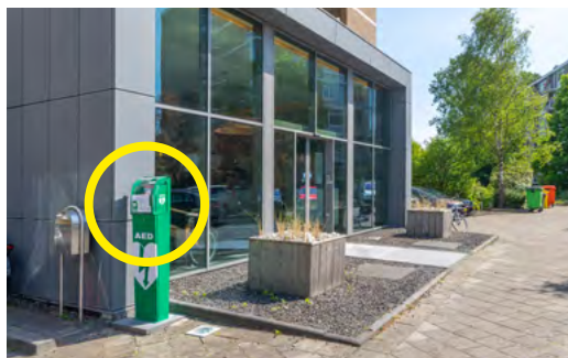
Sportlaan 40 - Advocatenkantoor