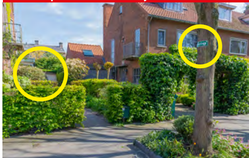
Kraaienlaan 90, AED naast de deur