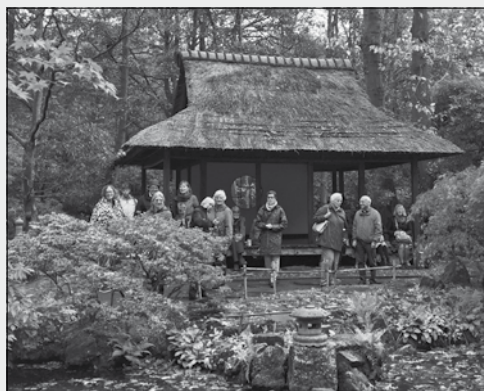
Samen genieten in de Japanse tuin