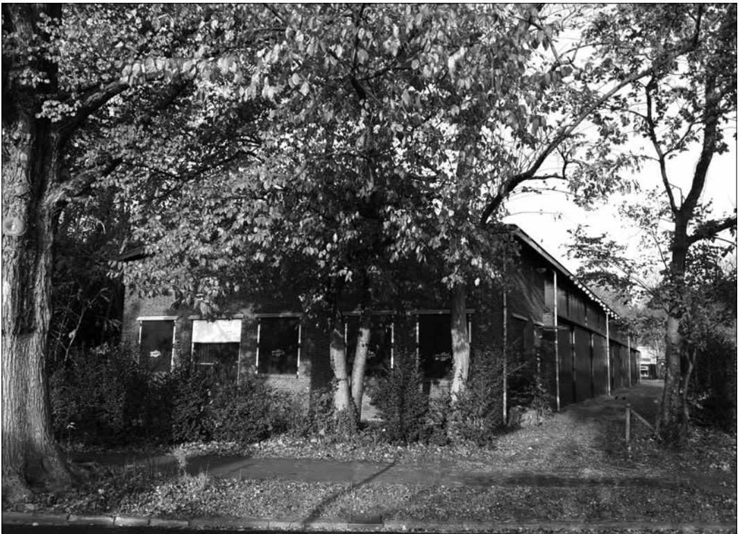
De toneelloods aan de Laan van Poot

De ledenvergadering vond plaats op een bijzondere locatie, te weten de 'theaterloods' aan de rand van de Bosjes van Poot, die in de oorlogsjaren als Duitse garage werd gebouwd, daarna opslagplaats werd voor de organisatie Bescherming Bevolking en vervolgens voor de in 2016 ter ziele gegane toneelgroep De Appel. Sinds het afgelopen voorjaar fungeert