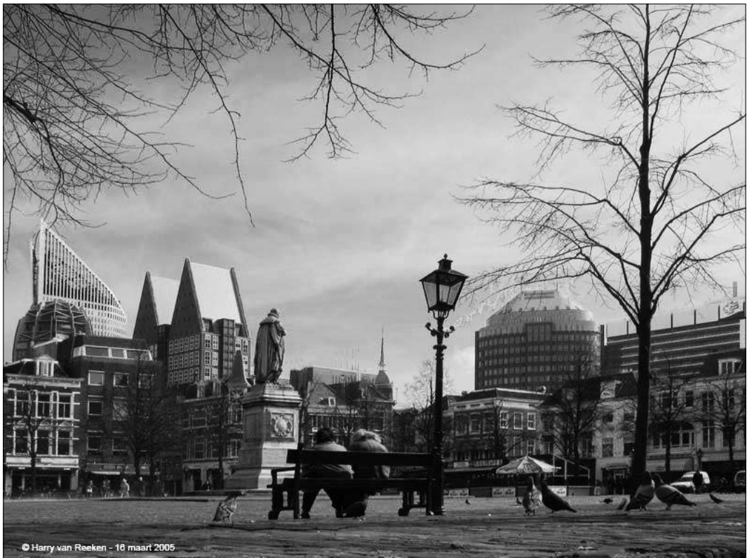
Een karaktervolle foto van het Plein uit Harry's uitgebreide collectie

„Ik krijg een stuk of vijf mailtjes per week. Veel mails komen van oud-Hagenaars die nu in het buitenland wonen. Laatst kreeg ik een mail van mensen uit Australië die vroeger op de Paul Krugerlaan hadden gewoond. Zij vonden het bijzonder om te zien hoe het straatbeeld na zoveel jaar was veranderd. Oh ja, ook een keer een mail van een Hagenees vanuit Spanje; hij zat gedetineerd en vond het