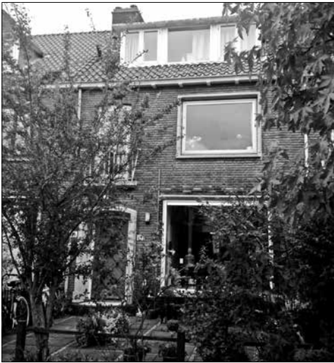
De woning aan de Kruisbeklaan