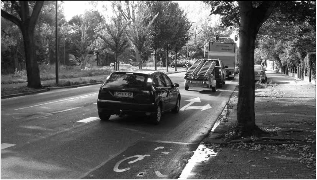
Het fietspad houdt plotseling op.

met onder andere meer klaprozen en minder van het hooikoortsbevorderende (on)kruid Ambrosia.