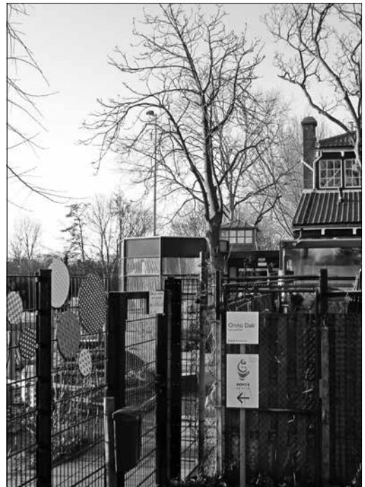
De toegang tot kinderopvang Onno Dak en Koffie en Kind naast het tennispaviljoen