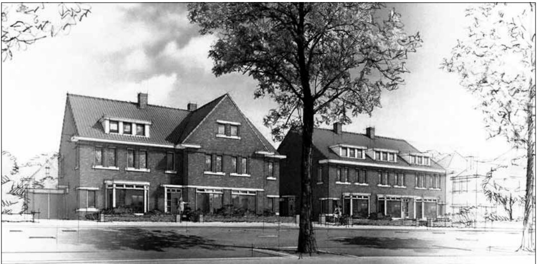
Impressie van het Kavelplan