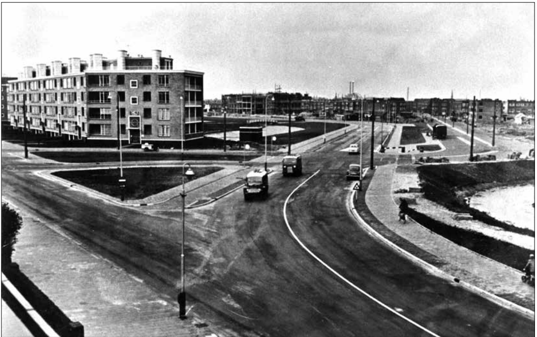
De splitsing Sportlaan/Segbroeklaan in 1955, een jaar na oplevering van het laatste flatblok.