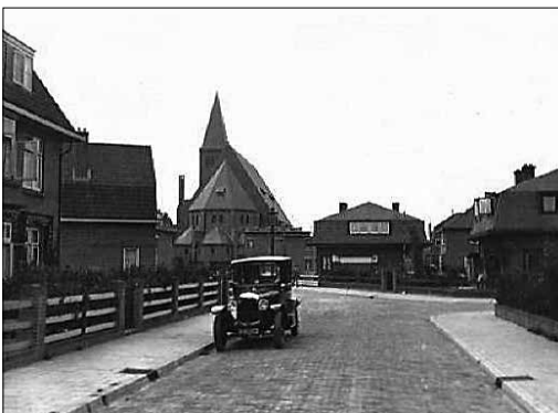
De Koekoeklaan anno 1928.