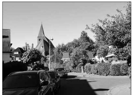
De Koekoeklaan anno nu.