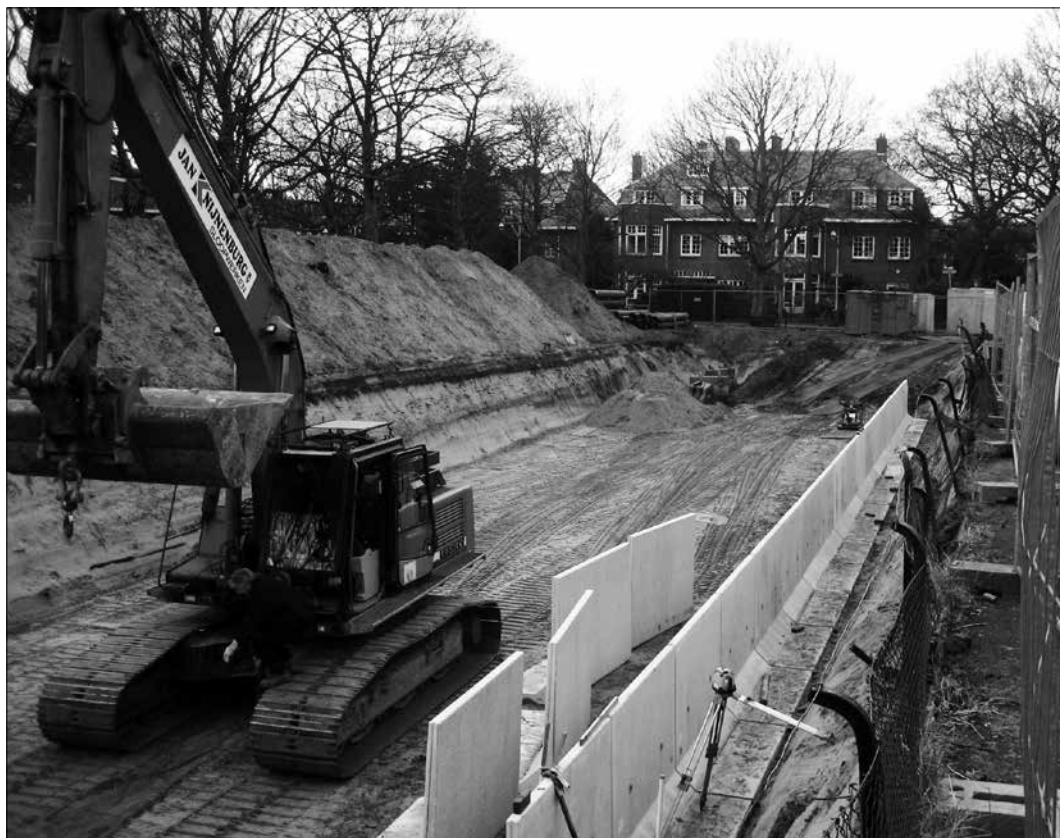
De Grondwatercommissie vindt dat het systeem voor regenwaterafvoer in de wijk (met opvang in ondergrondse bassins) reguleerbaar moet worden gemaakt. Op de foto de aanleg van het eerste opvangbekken in de wijk in 2007, onder het Mezenplein.

rioolsysteem zo ‘gedimensioneerd’ dat het niet kón leiden tot een aanmerkelijke verhoging van de grondwaterstanden in de wijk. De effecten van de twee andere projecten op de grondwaterstand achtten zij miniem.