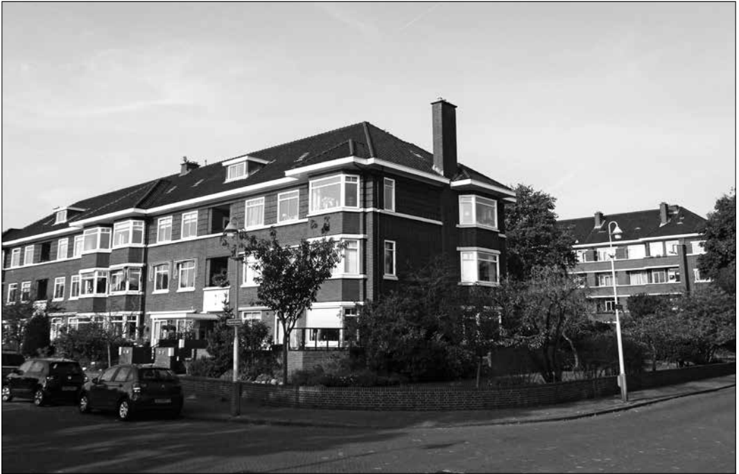
De statige Fazantflat, met rechts de Snijplaan.