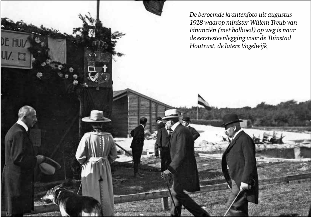
De beroemde krantenfoto uit augustus 1918 waarop minister Willem Treub van Financiën (met bolhoed) op weg is naar de eerstesteenlegging voor de Tuinstad Houtrust, de latere Vogelwijk