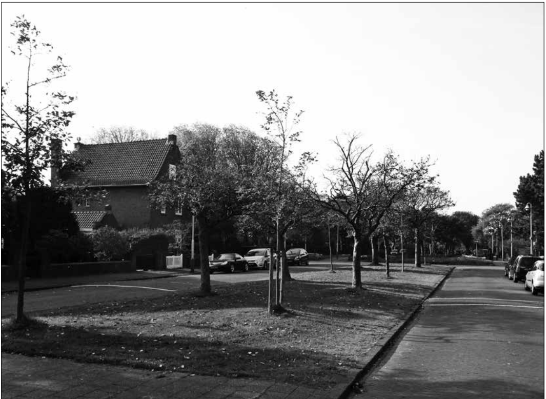
‘Wellicht krijgen de grasperken en -stroken in november de laatste maaibeurt van het jaar’

„Niks ten nadele van Segbroek, maar Haagse Hout vind ik nog steeds schitterend,” zegt hij.