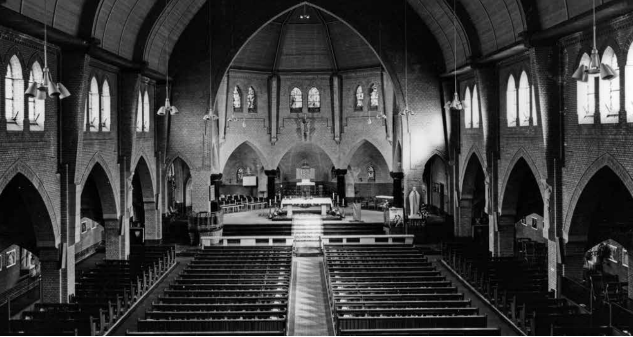
Het interieur van de kerk, eind jaren tachtig