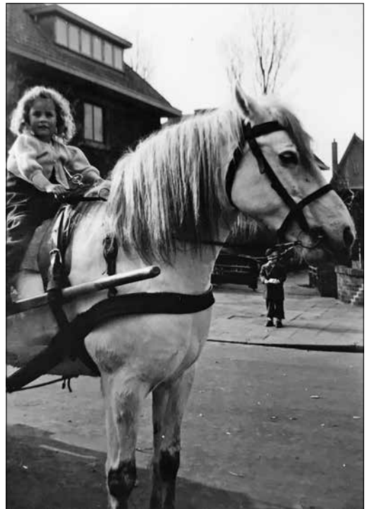
Loesje in 1949