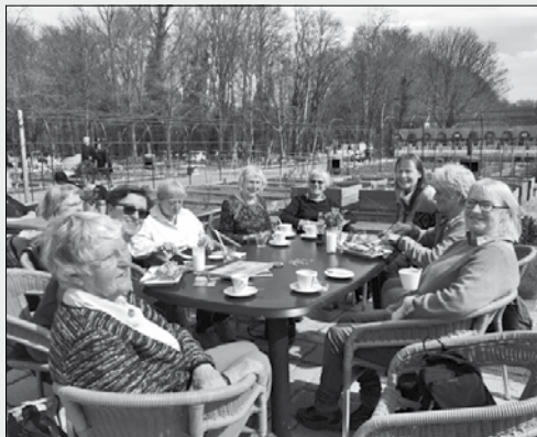
Op het terras bij de buitenplaats Ockenburgh

In maart en april hebben we weer een paar leuke dingen gedaan. De wandeling van 10 april in het Hyacintenbos in Ockenburgh onder leiding van een IVN-gids maakten we onder een stralende zon. Omdat het zo koud was geweest, waren de hyacinten helaas nog niet in bloei. Alles was een paar weken later dan normaal. Voor de hyacinten moeten we dus nog een keer terug komen, maar er was toch genoeg te zien en te horen. We zagen buizerds en hoorden spechten en de gids wees ons op allerlei specifieke dingen in dit speciale stukje bos.