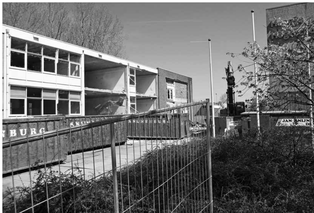
De sloop van het HALO-complex is in volle gang

deelden het ontwerp als passend en mooi. Ook de groenin-vulling van de zone rond het toekomstig complex kwam aan de orde. De gemeente had eerder na overleg tussen de convenantpartners (wijkvereniging, Haag Atletiek, handbalvereniging Hellas en de gemeente zelf) de al verleende kapvergunning voor 50 bomen op deze kavel weer ingetrokken en aangegeven gezamenlijk met alle belanghebbenden nog eens te willen bezien hoe het kappen van – zo min mogelijk - bomen kan worden gecombineerd met een herbeplantingsplan. Tot geruststelling van de bezoekers van de informatieavond zegde de kopersvereniging toe aan die wens tegemoet te willen komen.