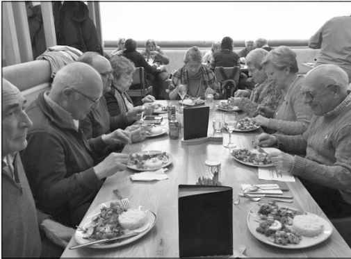
Samen genieten van diverse visgerechten

maaltijd wel hebben beperkt of zelfs geheel overgeslagen. Omdat we veel mensen hebben moeten teleurstellen doordat er niet meer zitplaatsen waren, zullen we bezien of we deze activiteit in het najaar nog een keer kunnen herhalen voor degenen die nu op de 'reserve-lijst' terecht waren gekomen.