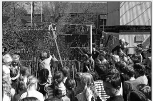
Een leerling gaf met een gieter de net onthulde kastanje een flinke hoeveelheid water, want het was een warme aprildag

De zeven jaar oude kastanje bij de Nutsschool werd op 19 april officieel ‘onthuld’ door kinderen van de groepen 7 en 8, van wie enkele een paar citaten uit het dagboek van Anne Frank voorlezen. Uiteraard was voordien in de lessen ruime aandacht aan Anne Frank besteed.