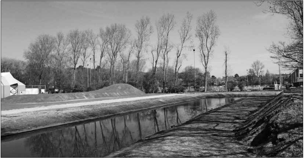
Achter het oude HALO-terrein wordt druk gewerkt aan de herinrichting van sportvelden

verschillende sporten konden worden beoefend. Dankzij het overleg en de kennis en ervaring van de betrokken sportverenigingen konden deze plannen gezamenlijk worden doorontwikkeld naar een definitieve ontwerp: twee ‘padelbanen’ en een groot multifunctioneel kunst-