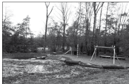
Hier is het onbedoelde vijvertje nog te zien

Daar kwam het afgelopen voorjaar nog een probleem bij. Een 'speelkuil', die de ontwerper had bedacht, bleef almaar vol water staan zodat het een vijvertje leek. Het was de bedoeling dat het een droge kuil zou zijn, die alleen na een regenbui wat drassig zou worden. Kinderen zouden dan door middel van grote stapstenen