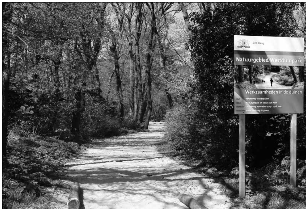
Zandpad in de Bosjes van Poot

Ik ben ook een groot natuurliefhebber en juich