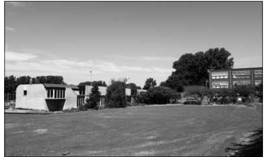
Het bouwterrein waar tot voor kort nog de HALO stond

Voor de initiatiefnemers van Hellasduin zat er daarom niets anders op dan te proberen de m2-prijs omlaag te krijgen. Dat is de afgelopen zomer gelukt, ten eerste door het ontwerp van het complex enigszins te versoberen en ten tweede door de beschikbare vloer ruimte te verdelen over meer appartementen: niet 38 maar 44. Het totale bouwvolume zou daardoor nauwelijks merkbaar (slechts zo'n 5 procent) groter worden. Enkele omwonenden hebben kenbaar gemaakt daar bezwaren tegen te hebben. Een bemiddelend gesprek bracht in augustus nog geen oplossing, maar