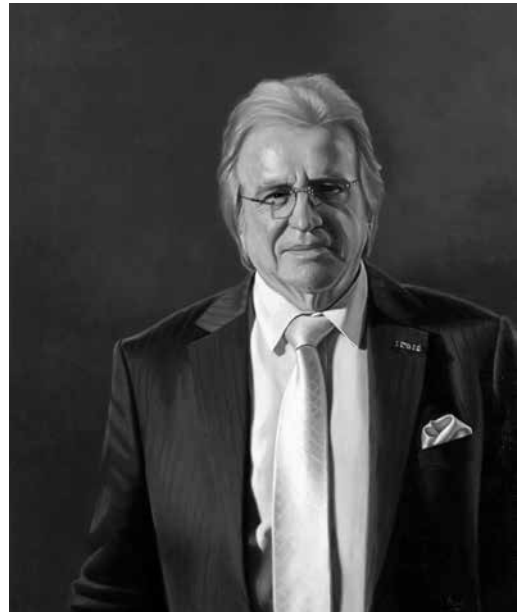
Het winnend portret van Leen Huizer alias Lee Towers

‘Dit ben ik!’, was tijdens de latere presentatie in het Rijksmuseum de eerste reactie van Lee Towers bij het zien van Berts schilderij. Daarmee maakte hij z'n uiteindelijke keuze eigenlijk al duidelijk. Het verraste Bert niet dat het schilderij de geportretteerde aansprak.