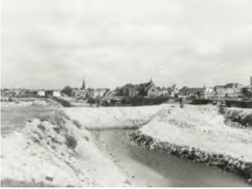
Deel van de tankgracht in de zomer van 1945, ter hoogte van de Fahrenheitstraat, met op de achtergrond de gespaarde Vrijzinnig-hervormde kerk aan het eind van de Beeklaan

stond. Misschien wel een oorlogsmenu van tulpenbollen en tomatensoep uit de gaarkeuken in de Cederstraat. Jarenlang heb ik geen tomatensoep meer willen eten. Afschuwelijk!