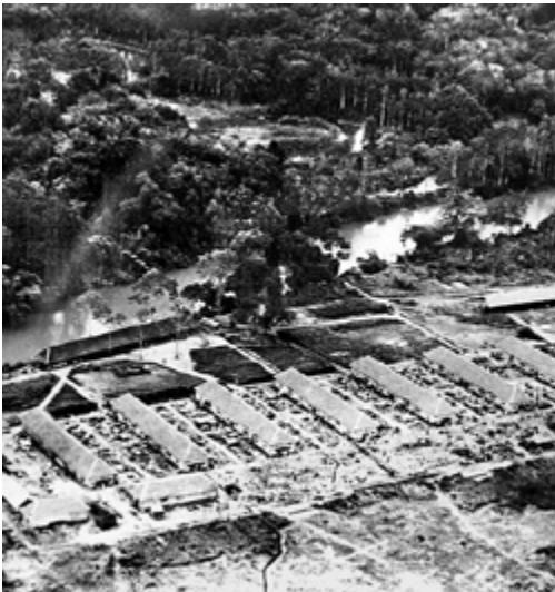
Kamp Si Rengo Rengo aan de rivier Bila