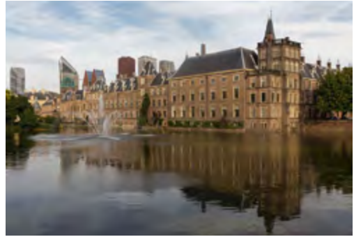
Vakantie in eigen stad, bijvoorbeeld met een wandeling langs de Haagse Beek, van de oorsprong in Kijkduin tot aan de Hofvijver waar hij uitmondt.

Dit inspireert mij om mijn fantasie de vrije loop te laten over wat er allemaal w el kan dicht bij huis. Een tent opzetten in je tuin? Een boek lezen van een schrijver uit je lievelingsland? In de duinen priv plekjes zoeken om te picknicken? Speurtochten uitzetten voor de familie? Vliegeren op het brede strand bij de Zand-