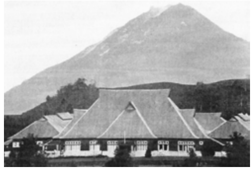
De kostschool in Brastagi