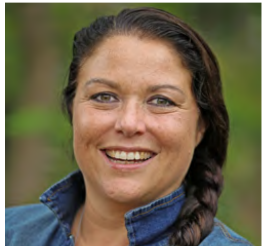
Corona Koek, Samenwerkende Kinderopvang

„Na de voorzichtig versoepelende maatregelen vanuit de overheid zal een deel van de online shoppers terugkeren naar de winkelstraten. Persoonlijk denk ik dat veel mensen online blijven winkelen vanwege het gemak en de service die ze ervaren. Ik ben dan ook erg positief over de toekomst van ons bedrijf.”