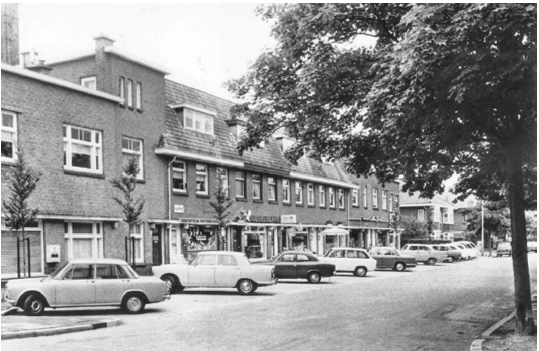
Ansichtkaart uit 1971 van het winkelrijtje aan de even kant van de Mezenlaan, met links (niet zichtbaar) de bakker en vervolgens een heren- en kinderkapsalon annex kantoorboekhandel, een stomerij, groentewinkel, slagerij, parfumerie en manufacturenzaak (later schoenmakerij).

Overigens bevonden zich op het pleintje ruim drie decennia lang twee groentezaken, want op nummer 55 aan de overkant, op de hoek met de Leeuweriklaan, dreven van 1927 tot 1962