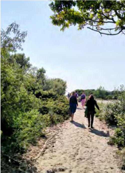
Dit voetpad naar strandpaviljoen De Staat is officieel een verhard pad, maar meestentijds bedekt met stuifzand