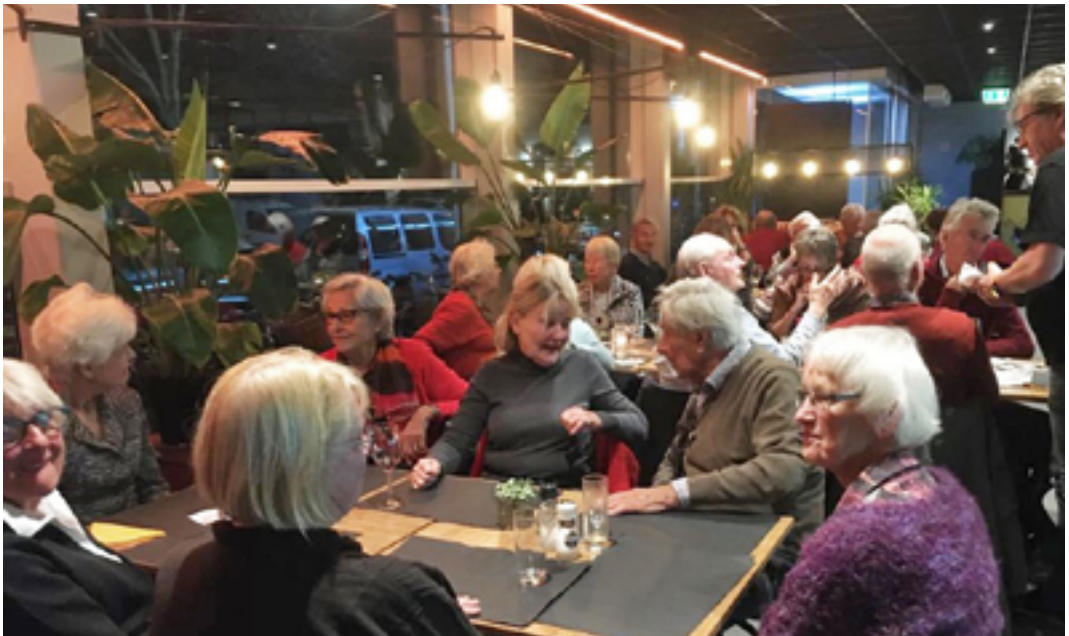
Impressie van de ontmoetingsavond op 30 oktober in het Squashcentrum Houtrust, waar dertig deelnemers genoten van de borrel en het aansluitende diner.

NB In december is er geen dineravond. De eerstvolgende ontmoeting is op maandag 31 januari. Nadere informatie bij Hedy de Munk: hmdemunk@gmail.com