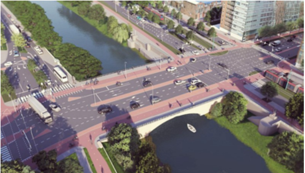
De Houtrustbrug en omgeving zoals die er na de werkzaamheden uit komen te zien