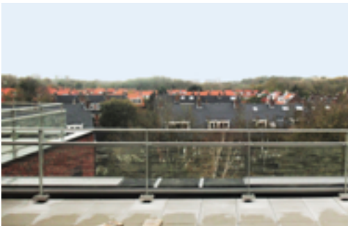
Uitzicht vanaf de topetage

Halverwege december begint een belangrijke nieuwe fase in het bouwproces. De twee appartementengebouwen van Hellasduin, die officieel Westduin en Oostduin gaan heten maar nu op de bouwplaats nog ‘Gebouw X en Gebouw Y’ worden genoemd, zullen tegen die tijd helemaal ‘dicht’ zijn. „Dan kunnen met behulp van de aangebrachte warmtepomp-installaties alle ruimten goed gaan drogen”, kondigt Pronk aan.