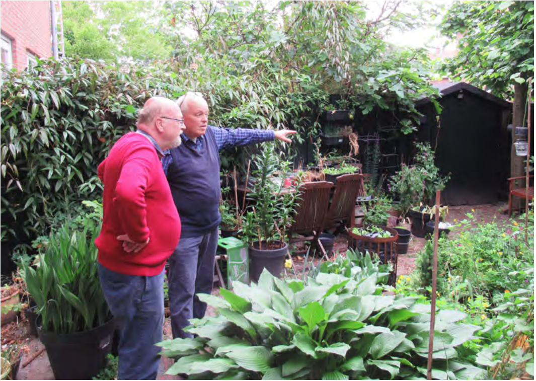
In de achtertuin: 'Daar was het kolenhok'

er kraakte en piepte”) ziet er nu heel anders uit. En bij het betreden van de achtertuin wijst de Hilversumse bezoeker direct naar links: „Daar stond het kolenhok!”