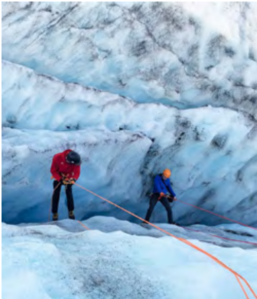
Met een groepje vrienden afdalen in ‘ice caves’