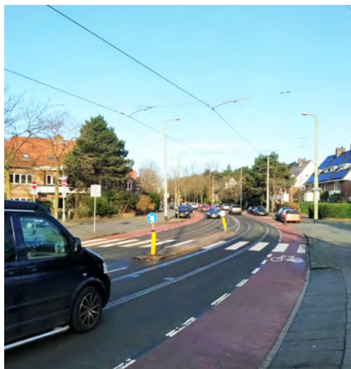
Het kruispunt Nieboerweg-Laan van Poot, waar de afgelopen jaren al vele ongelukken zijn gebeurd

We vertrouwen erop dat we met deze maat-