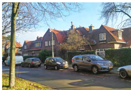
Laan van Poot ter hoogte van nummer 146