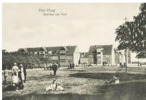
Open plek in de Bosjes van Poot (ca. 1921)

Toevallig waren ook daar pa en moe een avondje uit, maar de twee thuisgebleven jongens rennen op hun beurt weer naar een andere buurman voor hulp. Gealarmeerd door het geklop en gebel van de jongens rent deze buurman ten slotte naar buiten. Daar ziet hij voor de deur van nummer 146 een jonge vrouw, die zich nauwelijks staande lijkt te kunnen houden, leunend tegen de deurpost. Inmiddels zijn er meer buren op het lawaai af gekomen en bij het zien van al die mensen steekt zij de handen omhoog en lijkt een vergeefse poging te doen om te schreeuwen. Waarom er geen geluid uit het meisje komt,