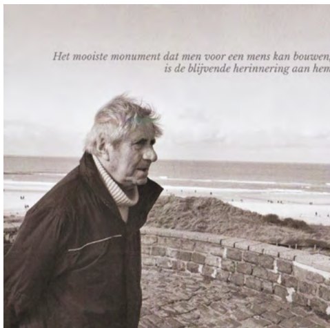
Deze afbeelding sierde de rouwkaart

Op 11 november deelde hij nog vrolijk snoepjes uit aan kinderen die met hun Sint-Maartenslampionnen langskwamen. Niet veel later werd hij ziek. Een blaasontsteking bleek meer te zijn dan dat. Hij verzwakte zienderogen en op 26 december was de kaars opgebrand.