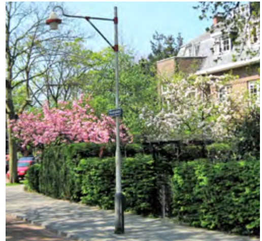
Bloeiende tuinbomen aan het Mezenplein

Allerlei do's en don'ts rondom het kiezen en aanplanten van een boom vind je op de website www.klimaatkrachtig.nl . Een boom met een lengte van 1,50 tot 2,50 meter kun je heel goed zelf planten. De kosten van aanschaf van een boom zijn nihil in het licht van de levensduur! Zoek een boom uit die past bij de uitgekozen plek (zon/schaduw en het type ondergrond nat/droog).