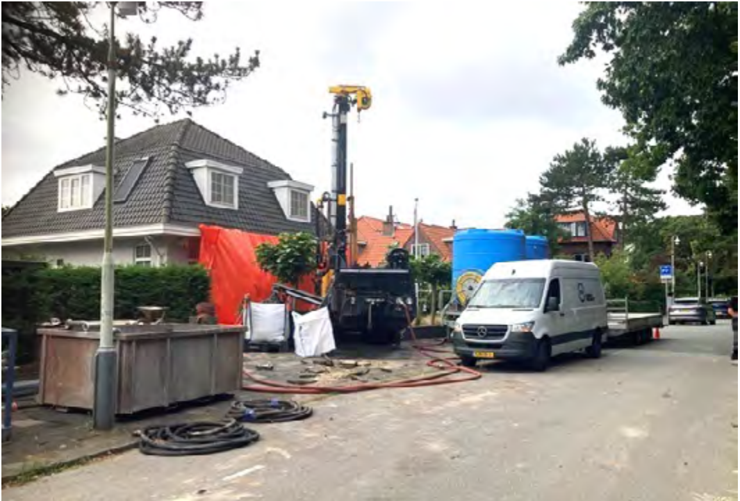
Het boorproces in volle gang

De verwarmingsbuizen in huis zijn geïsoleerd, alle radiatoren zijn ‘waterzijdig ingeregeld’ (ze warmen gelijkmatig op) en de radiatoren in de slaapkamers hebben thermostaatknoppen die geprogrammeerd kunnen worden. Zoals de meeste Vogelwijkhuizen hebben de buitenmuren, met uitzondering van de aangebouwde keuken, geen spouw. Isolatie aan de binnen- of buitenkant was niet echt een optie, maar verder is het huis zo goed mogelijk geïsoleerd: rondom hoogwaardig HR++ glas en de spouw van de aanbouw is gevuld met EPS-parels.