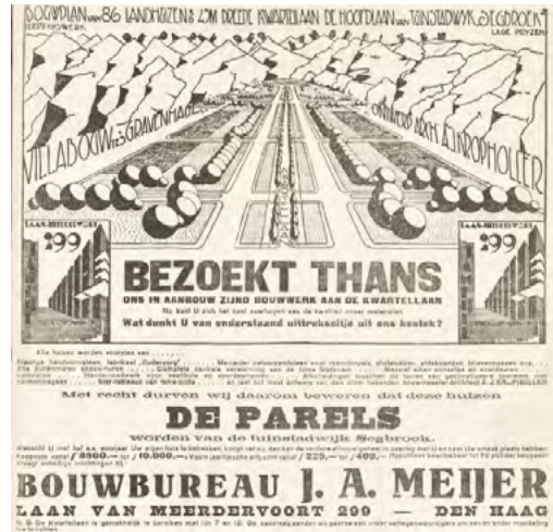
Wervende advertentie in de Haagsche Courant november 1927