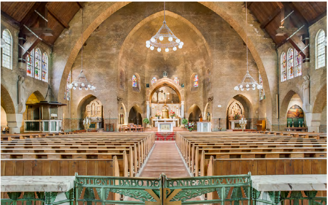
Interieur Paschalis Baylonkerk aan de Wassenaarseweg

Het college van B en W had de 'ontwerpwed-