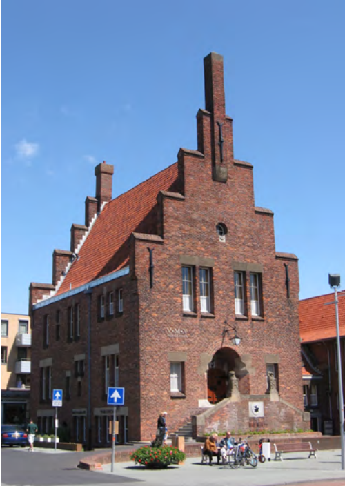
Oude Raadhuis in Wateringen