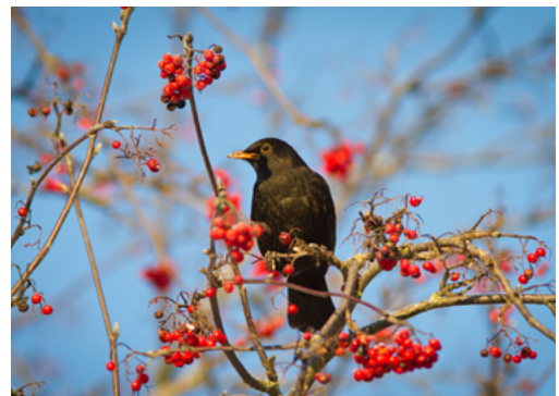
De lijsterbes is bij veel vogels geliefd

Zorg allereerst voor een tuin met voldoende beschutting en variatie in begroeiing. Bloeiende planten of bomen en struiken die fruit dragen zijn favoriet: de insecten die op bloemen afkomen vormen een fijne maaltijd en uitgebloeide bloemen zorgen voor zaden, die later in het jaar op het menu staan. Een lijsterbes bijvoorbeeld is bij vogels erg populair.