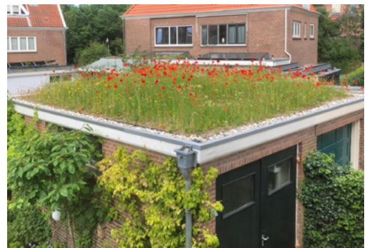
Groen garagedak van het type 'inheemse bloemenweide' aan de Nieboerweg, het afgelopen voorjaar aangelegd en in mei al uitgegroeid tot een feestelijk plaatje.

De Actie Groen Dak die wij het afgelopen voorjaar in onze groene wijk op touw hebben gezet, is een groot succes geworden. Al zo'n 80 huishoudens hebben zich de afgelopen maanden aangemeld om een dak, aanbouw of schuur te vergroenen. En de actie loopt nog steeds door.