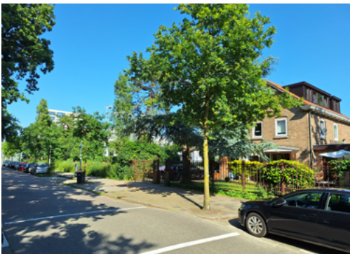
Het vrijstaande huis bij het tennispark