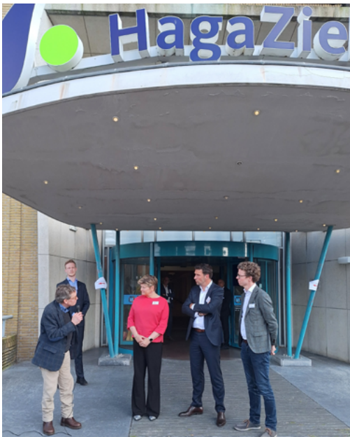
De drie wethouders voor de vroegere hoofdingang van het ziekenhuis