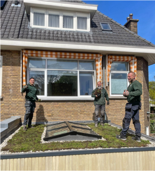
De mannen van de Groendakspecialist aan het werk

Groenverleiders aan met een subsidie van Hoogheemraadschap Delfland voor klimaatadaptatie. Dit alles kan in totaal wel tot 30% voordeel opleveren.