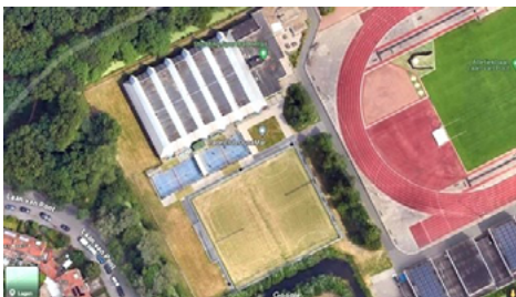
Op de handbalvelden van Hellas bij de atletiekbaan zou een tijdelijke turnhal moeten komen te staan

commodatie vervangt een turnhal aan de Groen van Prinstererlaan, die plaats moet maken voor de bouw van een supersporthal met twee etages.